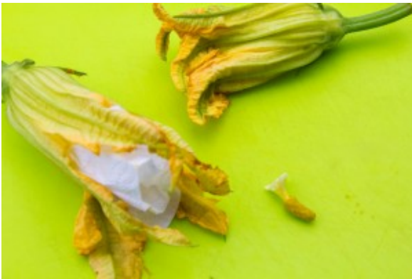
Otez les pistils