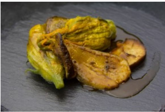
Fleurs de courgette farcies aux cèpes