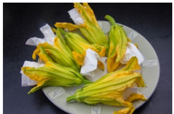
Faites de même pour toutes les fleurs