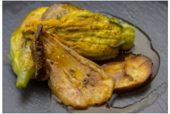
Fleurs de courgette farcies aux cèpes