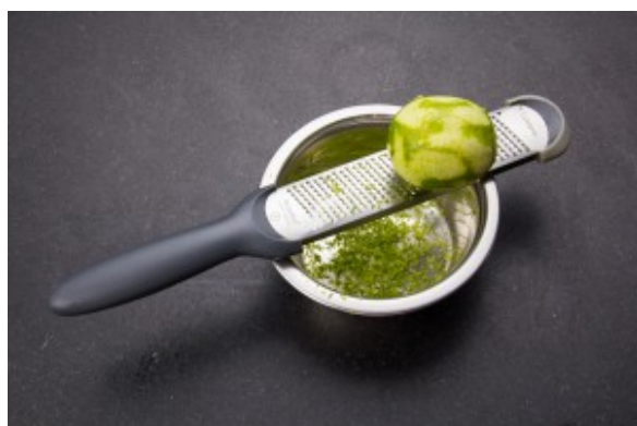
Zestez les citrons verts