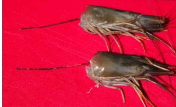
Tête et petit boyau