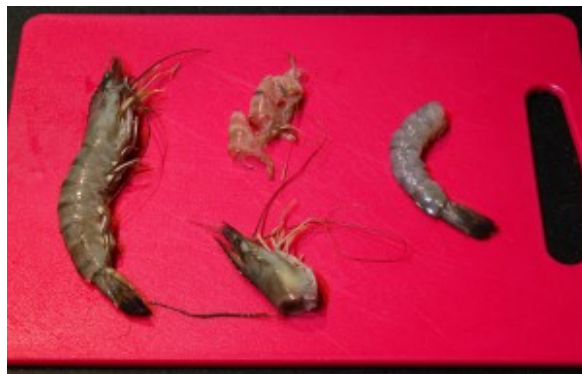
Décortiquez les gambas