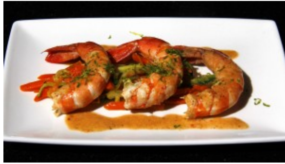
Les gambas en entrée.