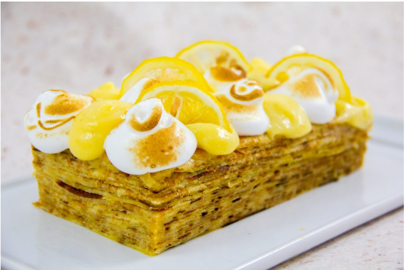
Gâteau de crêpes façon tarte au citron