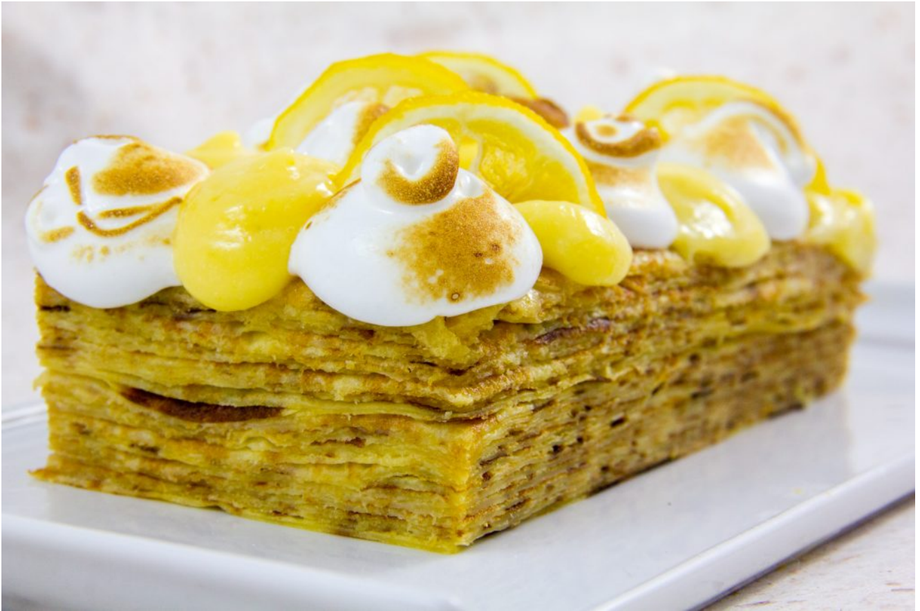
Gâteau de crêpes façon tarte au citron