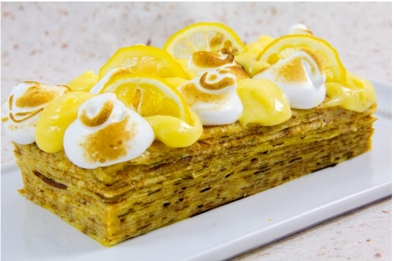
Gâteau de crêpes façon tarte au citron