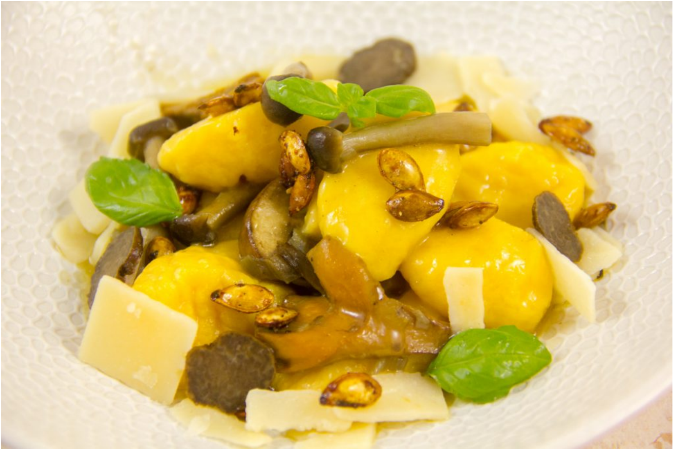
Gnocchis de butternut au parmesan et ses graines croustillantes, poêlée d'hiver