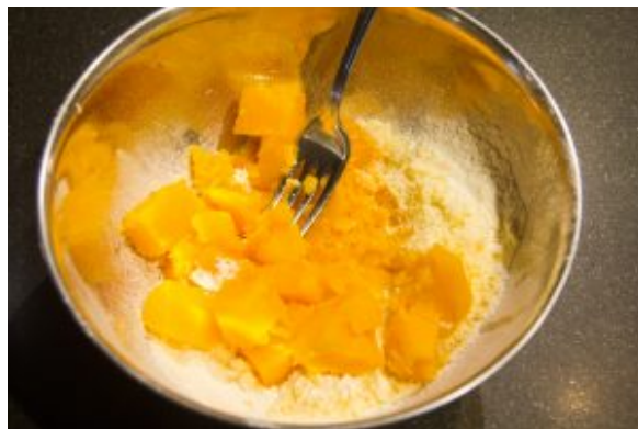
Ajoutez la chair du butternut refroidie à température ambiante