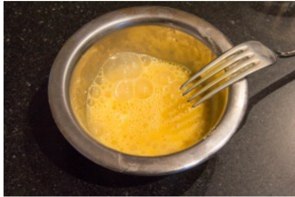
Battez l'œuf à la fourchette