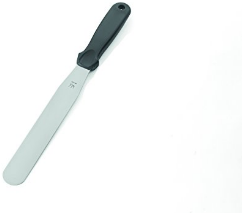
Silikomart 73.433.99.0001 Wonder Spatule SP 33 Acier Inox