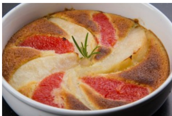
gratin poire et pamplemousse au romarin

C'est la pleine saison des poires. Aussi je vais vous proposer un dessert facile et surtout original: l'association insolite de la poire et du pamplemousse. La douceur des poires est réveillée par le peps du pamplemousse et le romarin amène le lien entre les deux fruits. Le romarin est une herbe aromatique que j'aime beaucoup et qui se marie parfaitement en dessert avec les fruits en amenant une saveur peu commune.