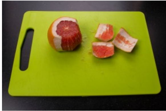
Pelez à vif