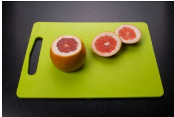
Coupez l'extrémité des pamplemousses