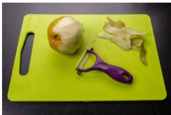
Pelez les poires