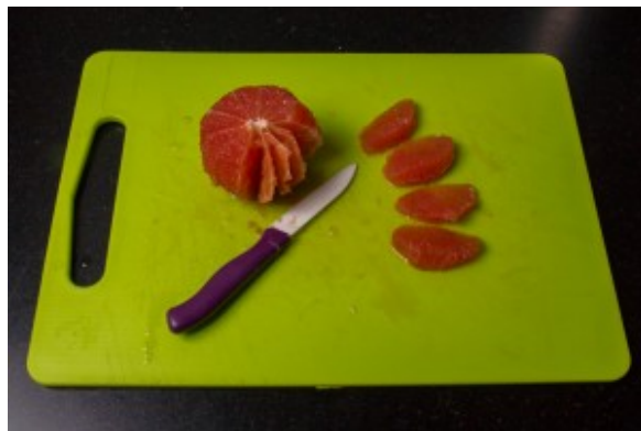
Prélevez les quartiers