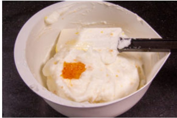
Île flottante chocolat mandarine