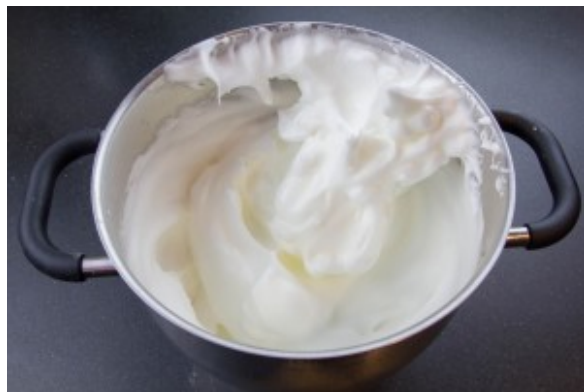
Montez les blancs d'œuf en neige