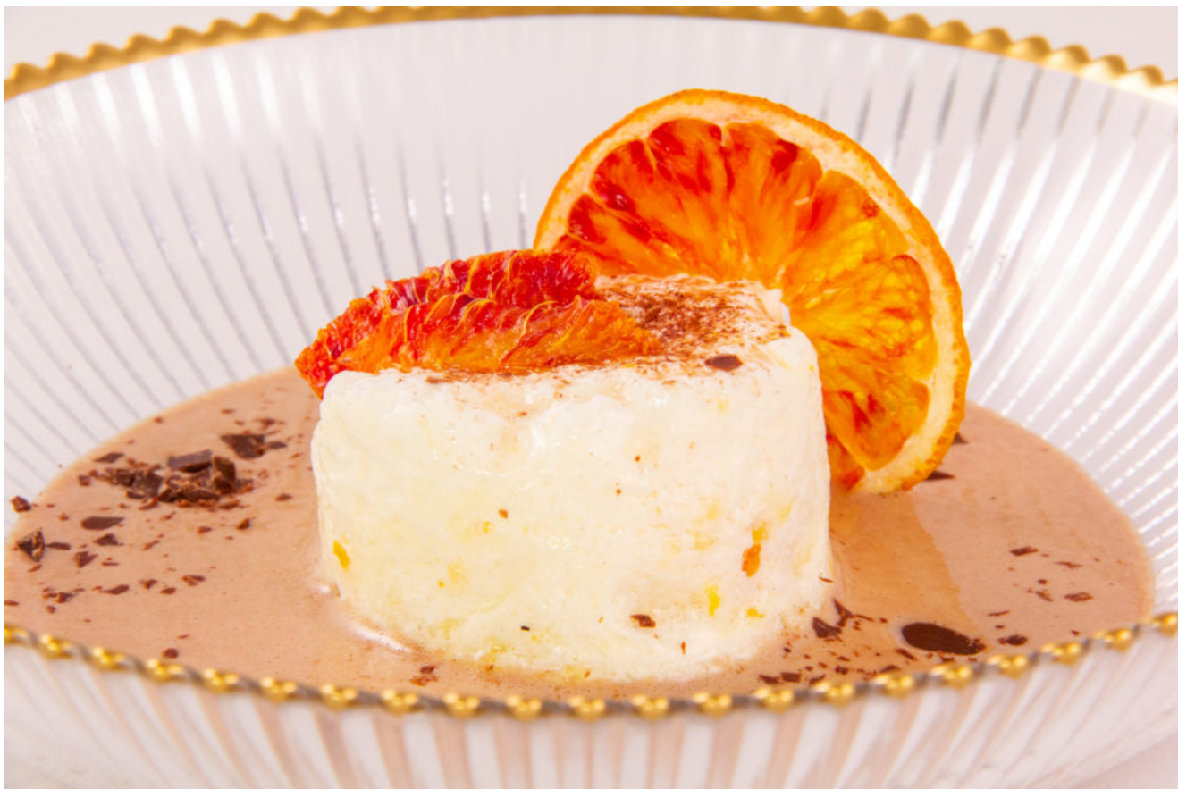
Île flottante chocolat mandarine

Vous connaissez tous ce dessert que tout le monde adore. Aujourd'hui je vous le propose dans une version encore plus gourmande!