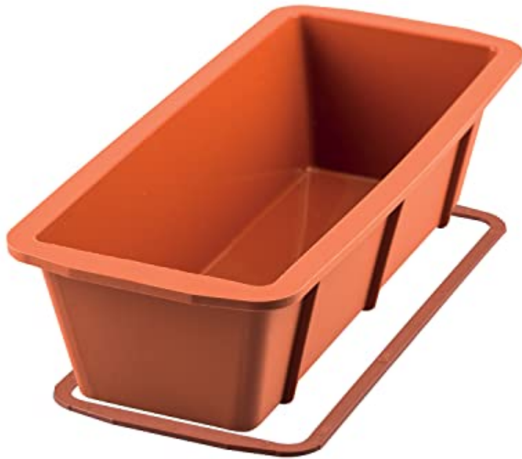
Silikomart 20.326.00.0060 SFT326 Moule Forme Plum-Cake Silicone Terre Cuite