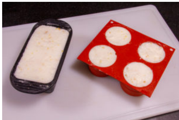
Versez les œufs en neige dans votre ou vos moules