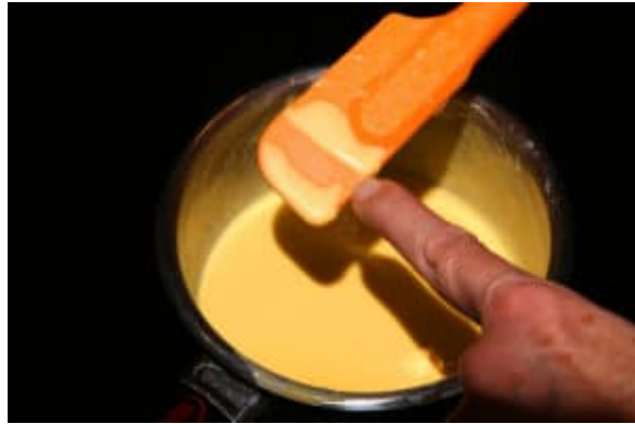
Île flottante chocolat mandarine