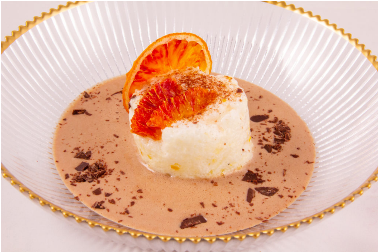
Île flottante chocolat mandarine