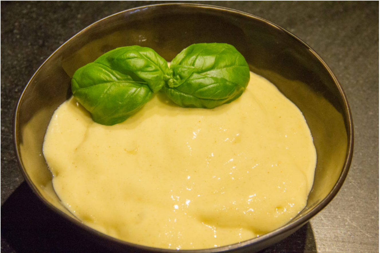
La « mayonnaise » sans huile de Jean François Piège