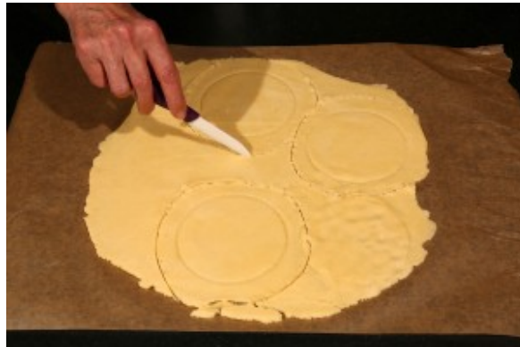
Découpez avec le couteau des cercles plus grands.