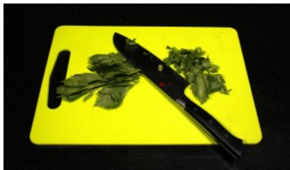
Coupez la branche de céleri en morceaux.