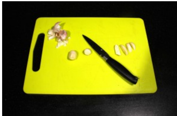
Épluchez les gousses d'ail