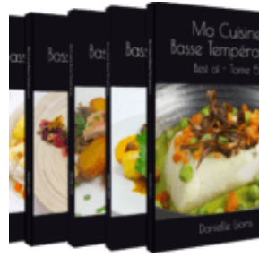
Tomes 1, 2, 3, 4, 5

Retrouvez-les ainsi que des recettes inédites dans les livres de ma collection « Ma Cuisine Basse Température, Best Of – Tome 1 » , « Ma Cuisine Basse Température, Best Of – Tome 2 » , « Ma Cuisine Basse Température, Best Of – Tome 3 » , « Ma cuisine basse température-Tome 4 » et enfin « Ma Cuisine basse Température, Best Of- Tome 5 » Les livres sont disponibles dès maintenant en version brochée ou en version Kindle. Voici les liens où vous pourrez les acquérir: