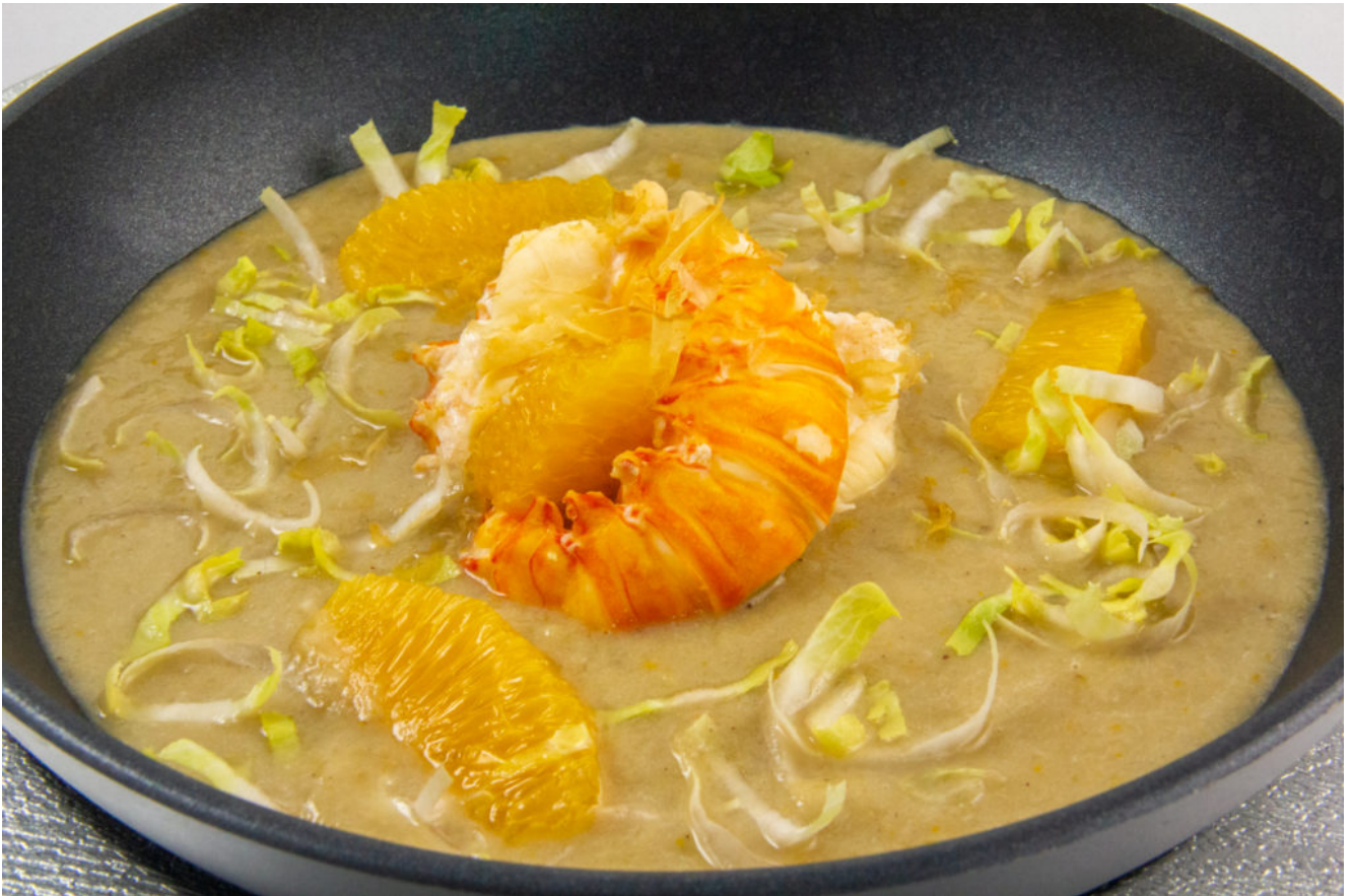
Langouste du grand Ch'Nord (recette basse température)