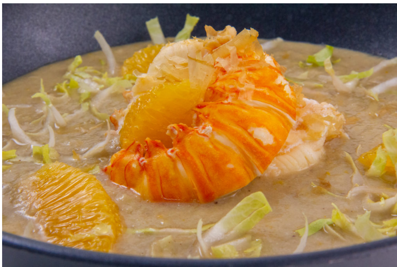
Langouste du grand Ch'Nord (recette basse température)

Pour la recette adaptée au Thermomix (sans basse température) cliquez ici .