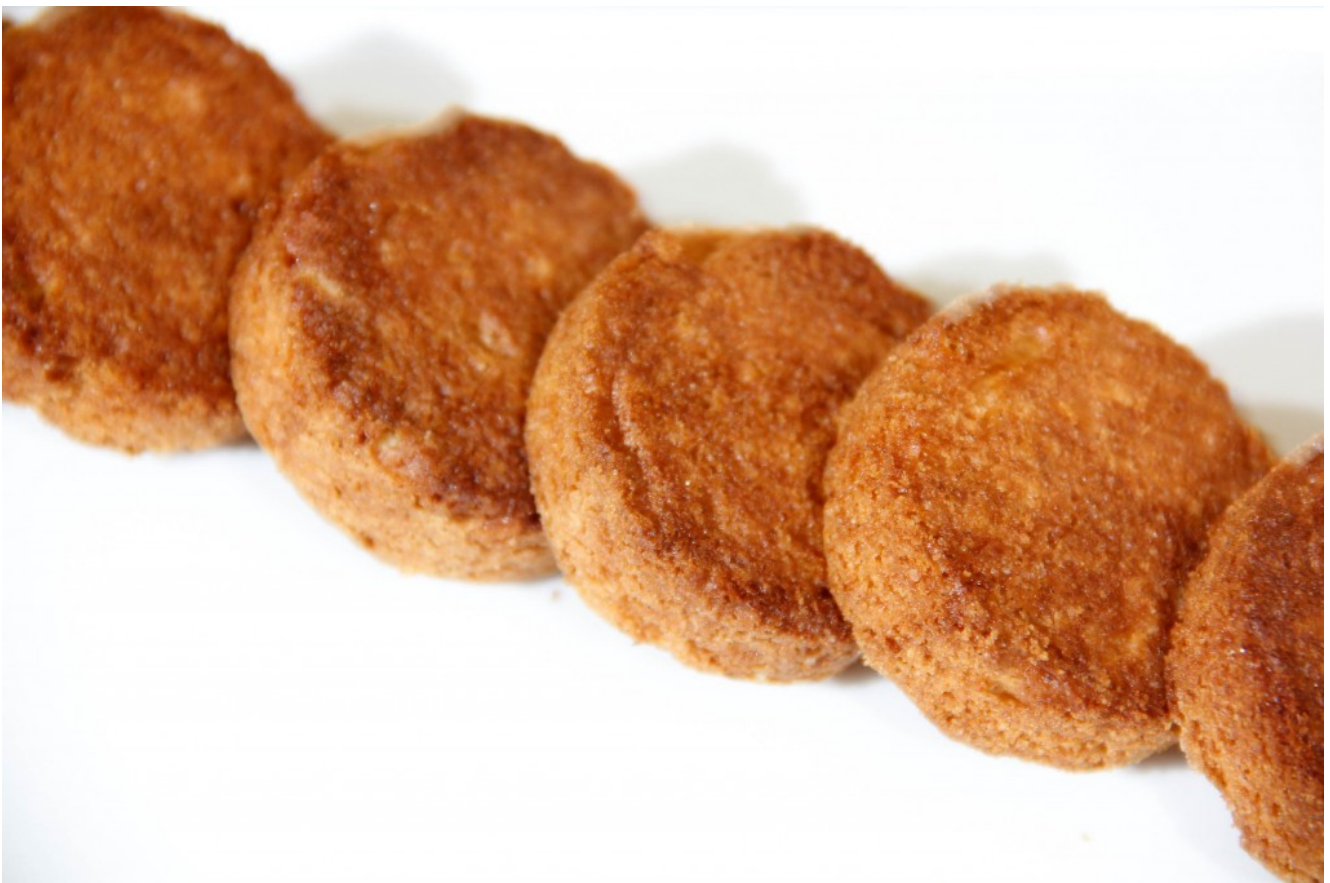
Des sablés bien dorés

Je prépare toujours une grosse quantité; comme cela je prépare à l'avance des petits boudins de pâte à sablé que je congèle. Je les sors une heure à l'avance du congélateur et après 10 mn de cuisson j'ai un très bon goûter ou une excellente base de dessert.