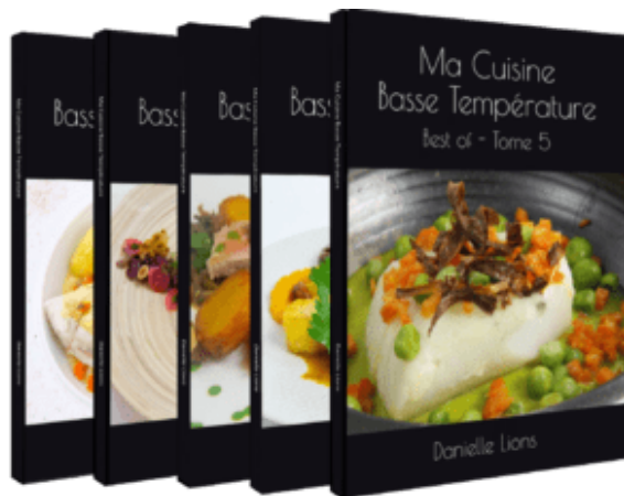
Tomes 1, 2, 3, 4, 5

Les livres sont disponibles dès maintenant en version brochée ou en version Kindle. Voici les liens où vous pourrez les acquérir: