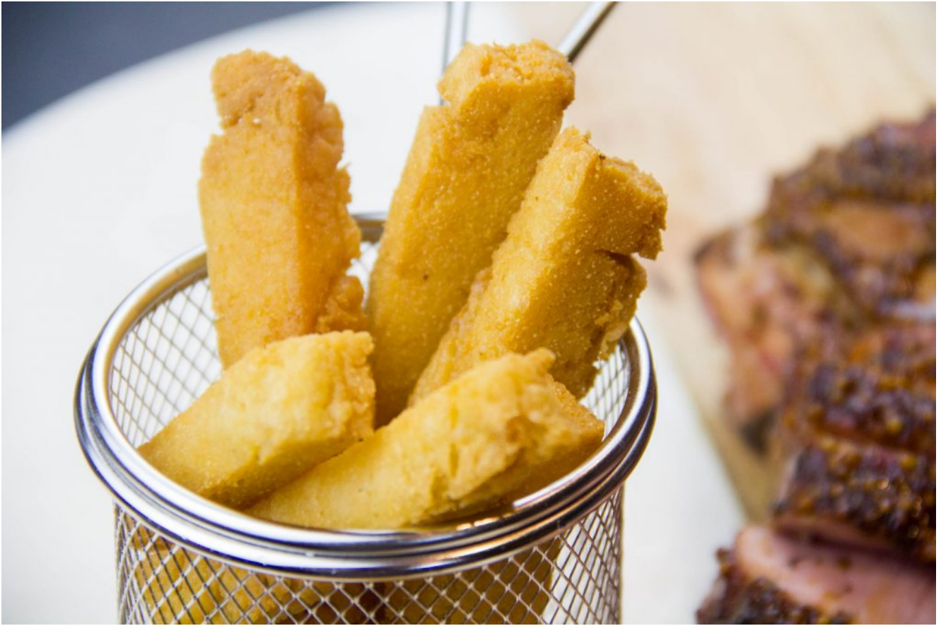
Les panisses ou frites provençales