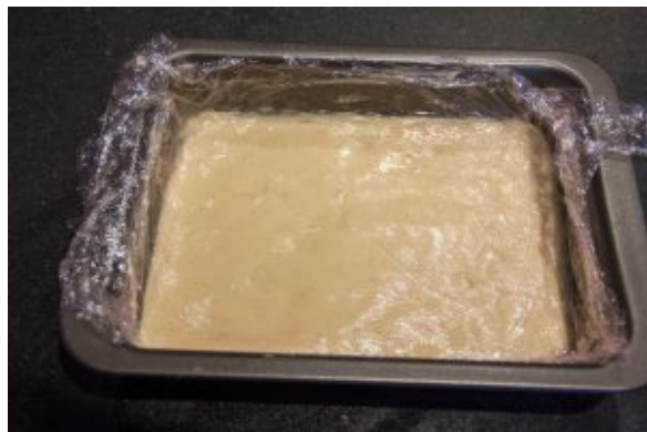
Recouvrez de film étirable