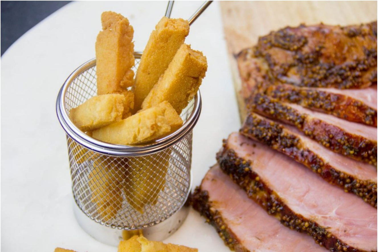
Les panisses ou frites provençales