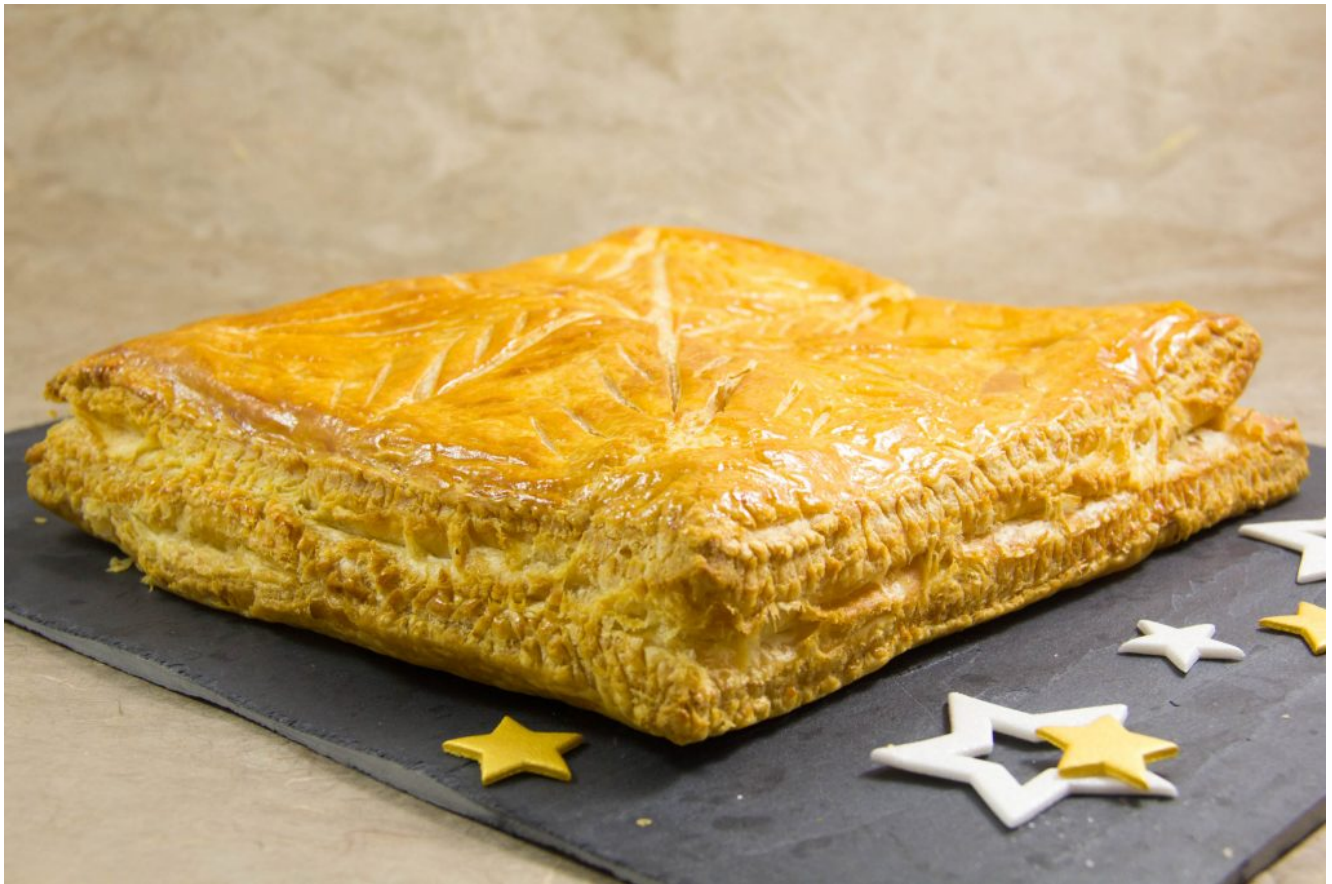
L'étoile des rois mages, ma galette des rois aux fruits d'Orient