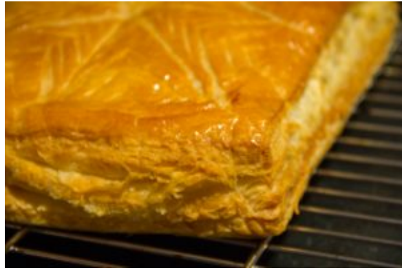
La galette a bien montée

Quand elle est refroidie il ne reste plus qu'à la poser sur un plat de présentation et à la croquer!