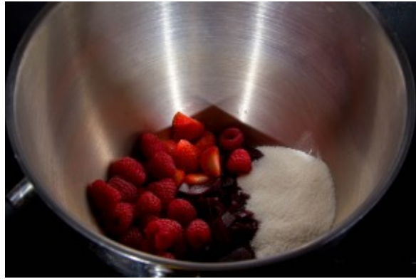
Fraises, framboise, betteraves et sucre