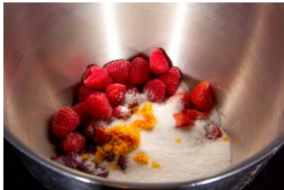
Ajoutez le zeste de l'orange