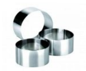
Petits cercles en inox