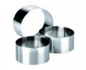
Petits cercles en inox