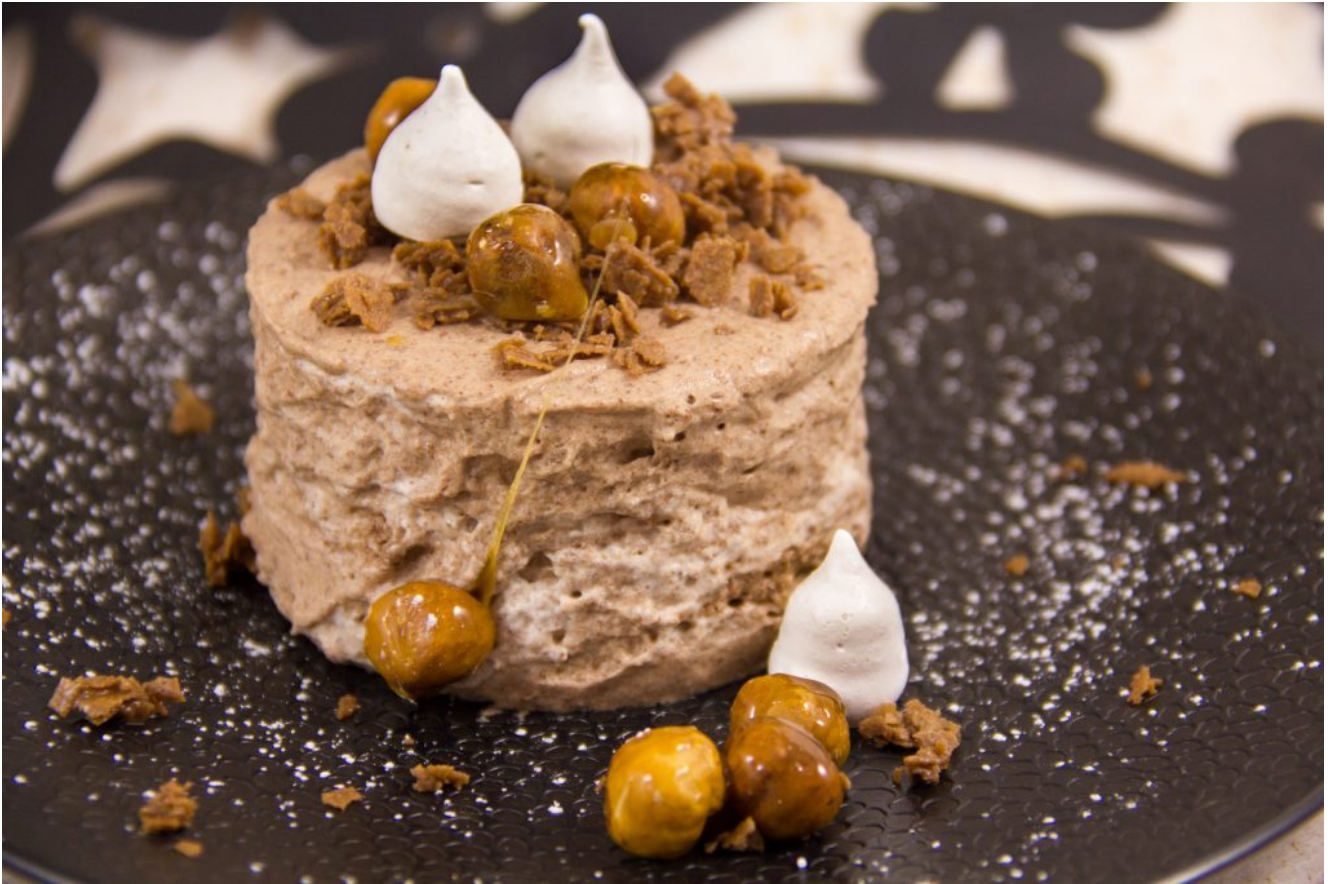
Ma mousse au chocolat de fête et ses pépites croquantes