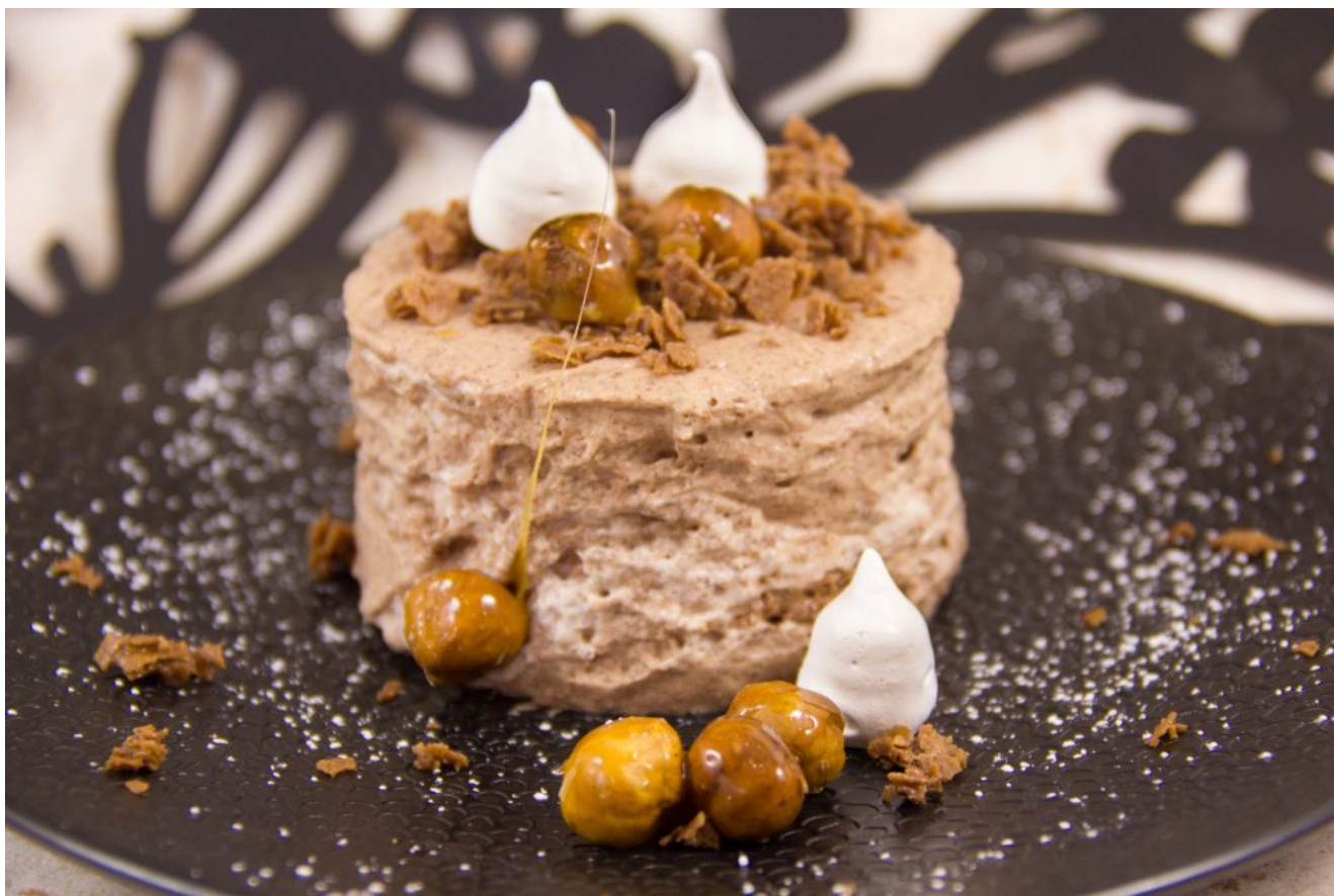
Ma mousse au chocolat de fêtes et ses pépites croquantes

Vous pouvez tout préparer la veille et terminer avec les éléments de décoration le jour même; c'est donc un dessert bien pratique si l'on veut passer plus de temps avec ses invités qu'en cuisine. Vous pouvez le servir également en verrines pour encore plus de facilité.