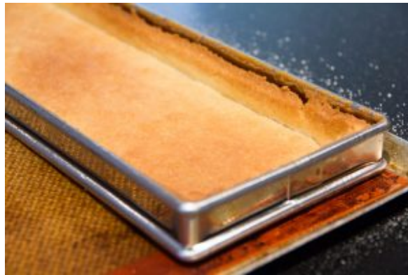
La pâte est cuite

Le crémeux framboise : pour la recette cliquez ici . N'oubliez pas d'augmenter la dose de gélatine par rapport à la recette originale (deux feuilles et demi)!