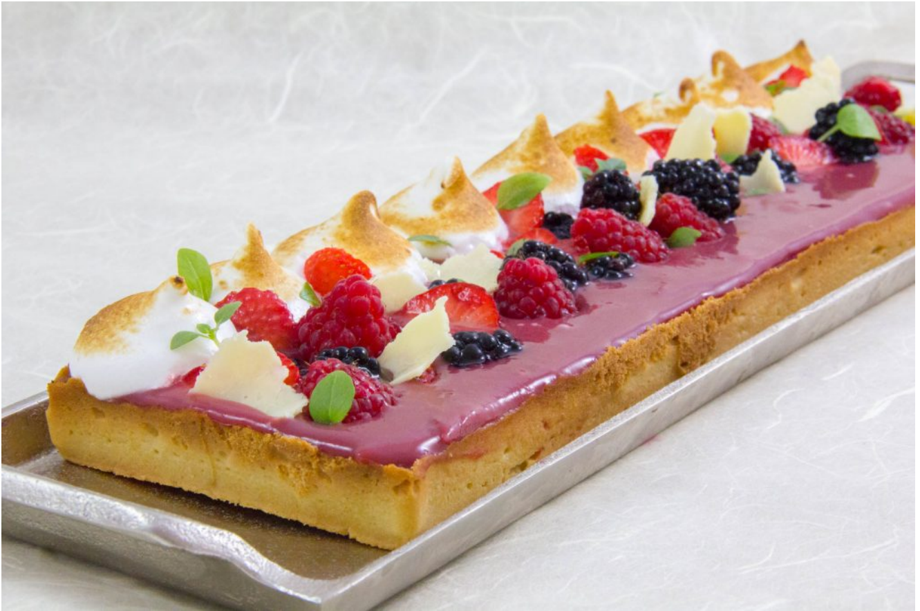
Ma tarte crémeuse meringuée aux framboises et ses fruits rouges