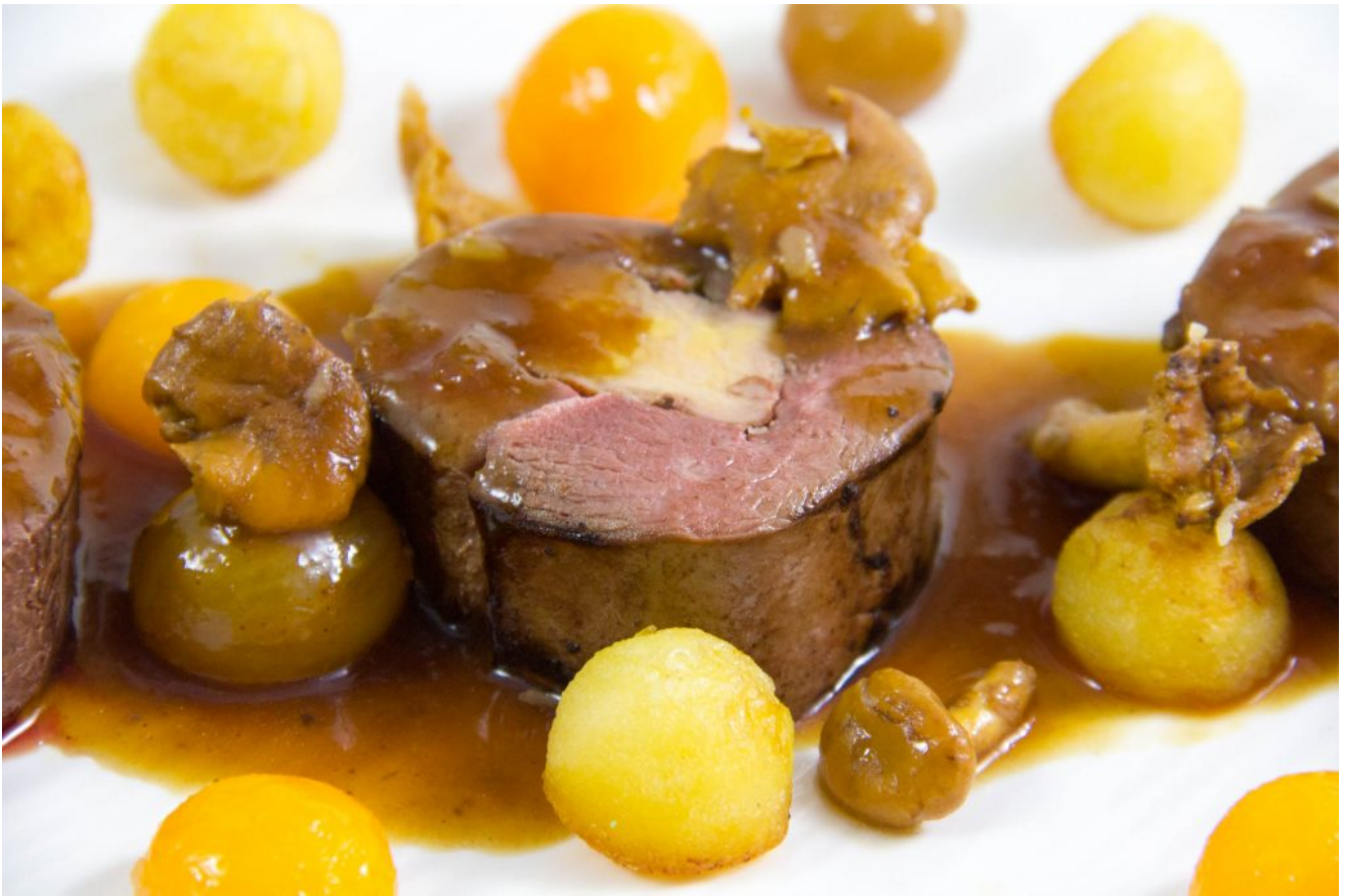
Magret de canard farci au foie gras, sauce au raisin de Philippe Etchebest