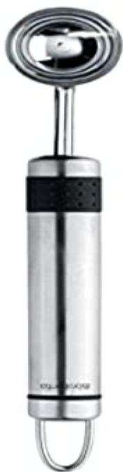
Brabantia 211041 Profile Cuillère à Fruits