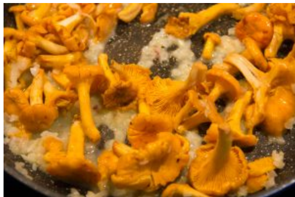
Faites revenir les girolles dans du beurre