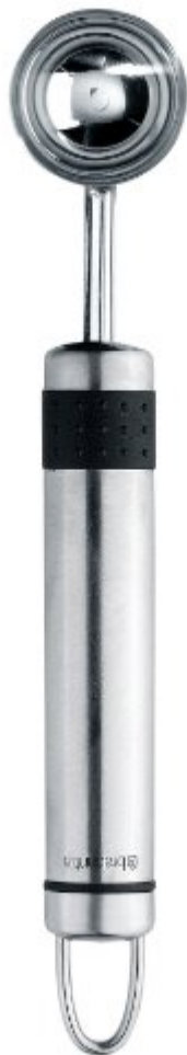
Brabantia 211041 Profile Cuillère à Fruits