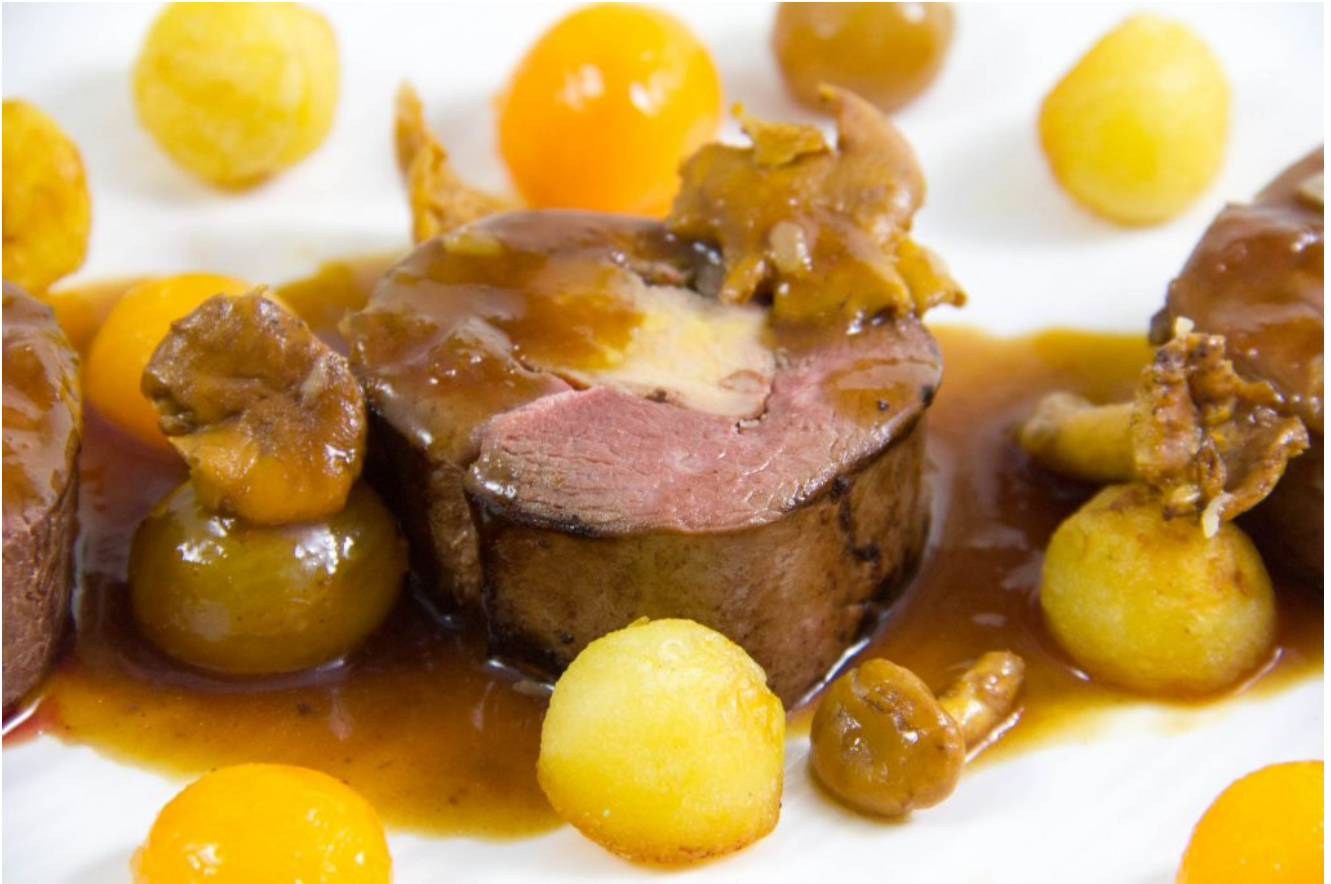
Magret de canard farci au foie gras, sauce au raisin de Philippe Etchebest