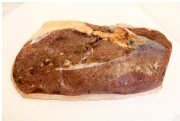
La chair s'est raffermie au contact du sel