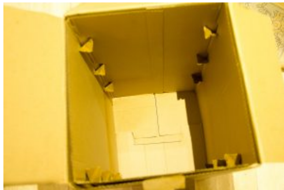
intérieur du carton