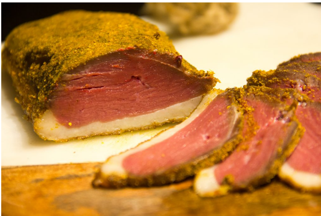
Magret fumé maison

Et l'autre grand avantage est que votre magret va vous revenir beaucoup moins cher et il sera bien meilleur!