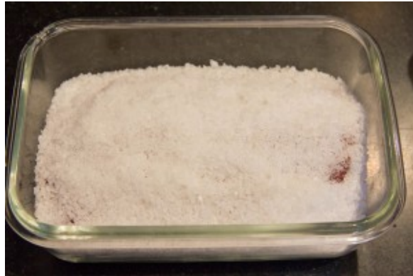
Puis recouvrez de sel