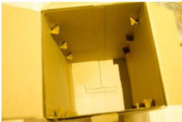
intérieur du carton