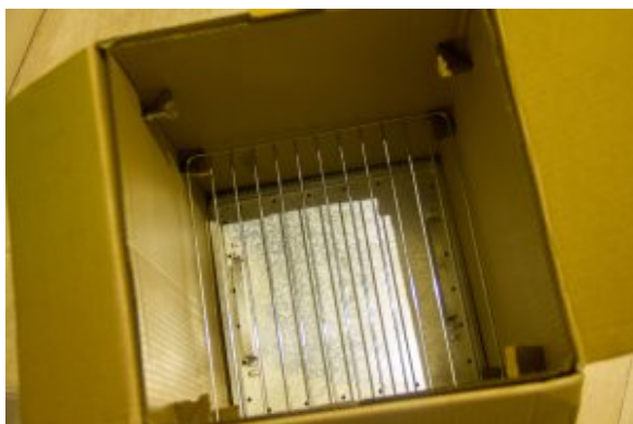
insertion des grilles à l'intérieur du carton