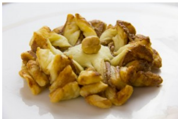
Marguerite aux noisettes

C'est une recette simplissime et très rapide à faire (10 mn de préparation et 12 mn de cuisson). Vous allez devenir la reine du goûter aux yeux de vos enfants grâce à ces petites marguerites aux noisettes!