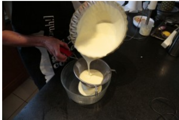
Filtrez le crémeux de pommes de terre