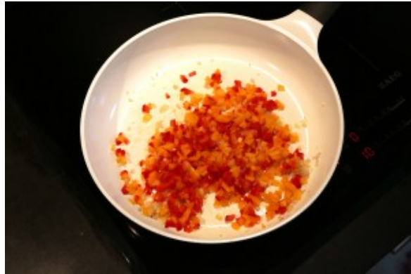
Ajoutez les poivrons