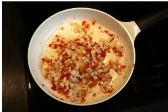
Ajoutez les ds de calmar