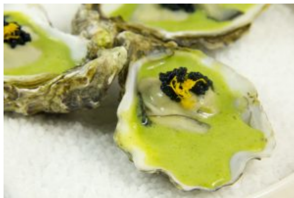
Huîtres mi cuites, crème d'estragon et perles de la mer

En apéritif: Huîtres mi-cuites, crème d'estragon et perle de la mer. Cette recette sera publiée le 29 novembre 2018