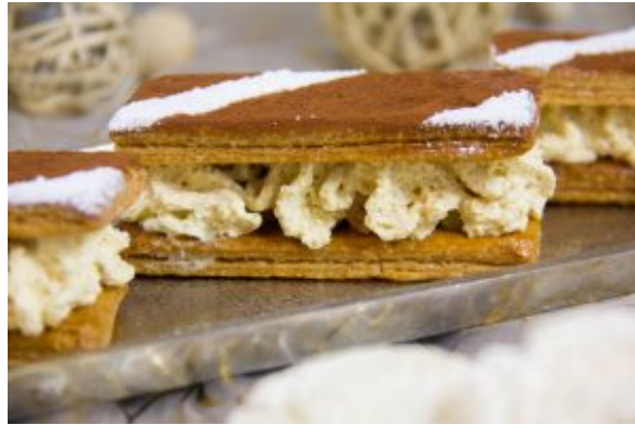
Mon foie gras de Gala

En plat: Caille basse température, butternut, morille, sauce au vin et aux figues. Cette recette sera publiée le 13 décembre 2018