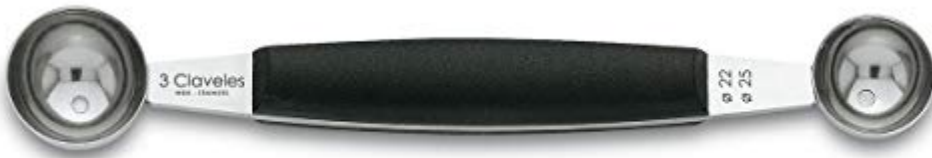
3 Claveles 4800 - Cuillère parisienne double 22 et 25 mm