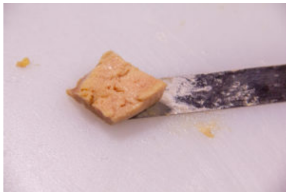
Coupez le foie gras en tranches puis en petits carrés de 4 cm sur 4 cm