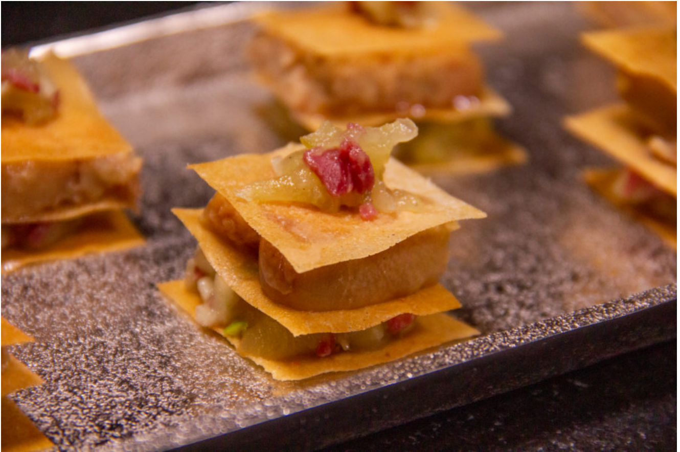
Mille feuille Foie gras, magret fumé et pomme