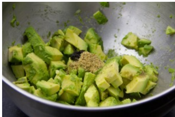
Écrasez la pulpe d'avocat grossièrement