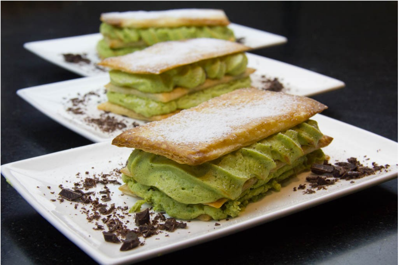
Mille feuille soufflé à l'avocat et chocolat