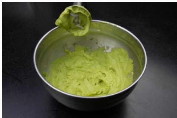
Mixez le tou