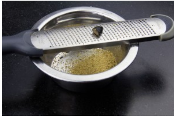
Râpez la fève tonka