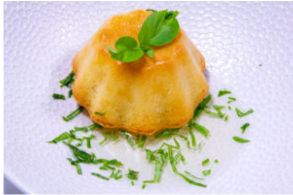
Moelleux au citron, sirop au basilic thaïlandais