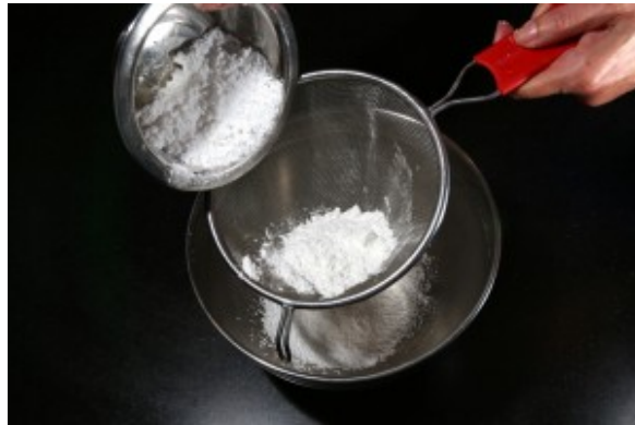
Tamisez les poudres