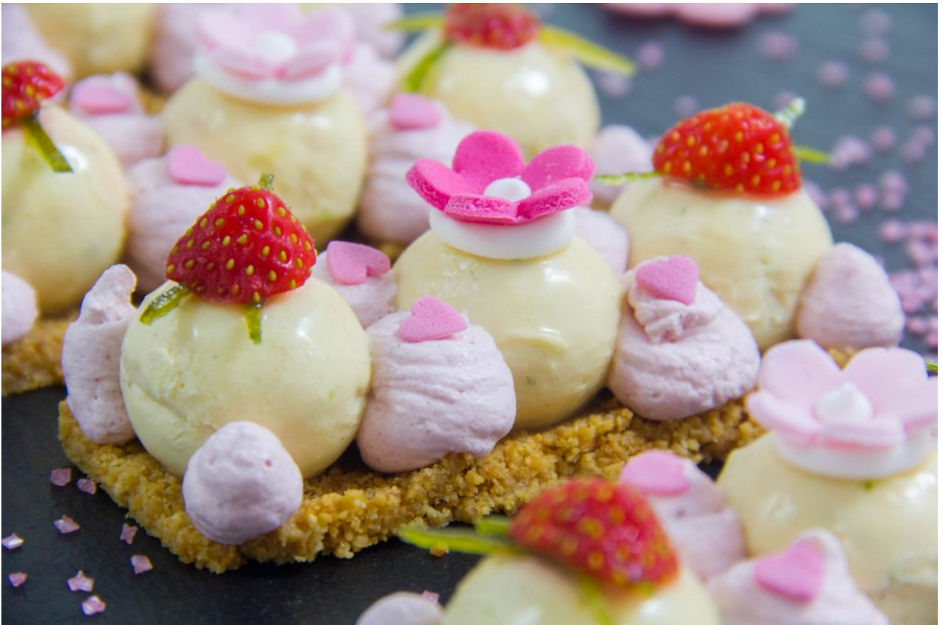
Mon Cheesecake revisité façon girly, fraise et citron vert