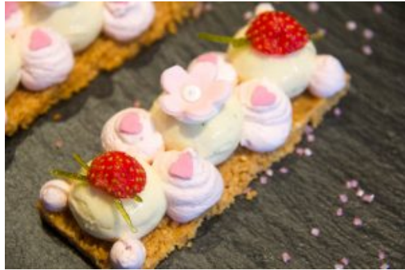
Mon Cheesecake revisité façon girly, fraise et citron vert