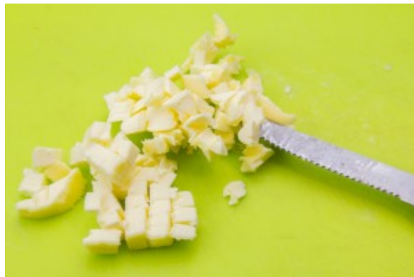
Coupez le beurre en tout petits cubes