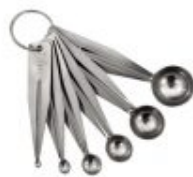
Cuillère à pomme parisienne