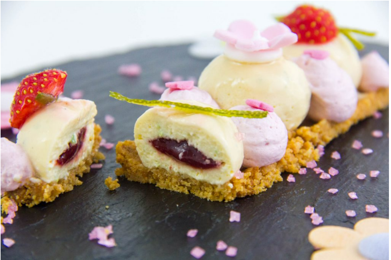
Mon Cheesecake revisité façon girly, fraise et citron vert