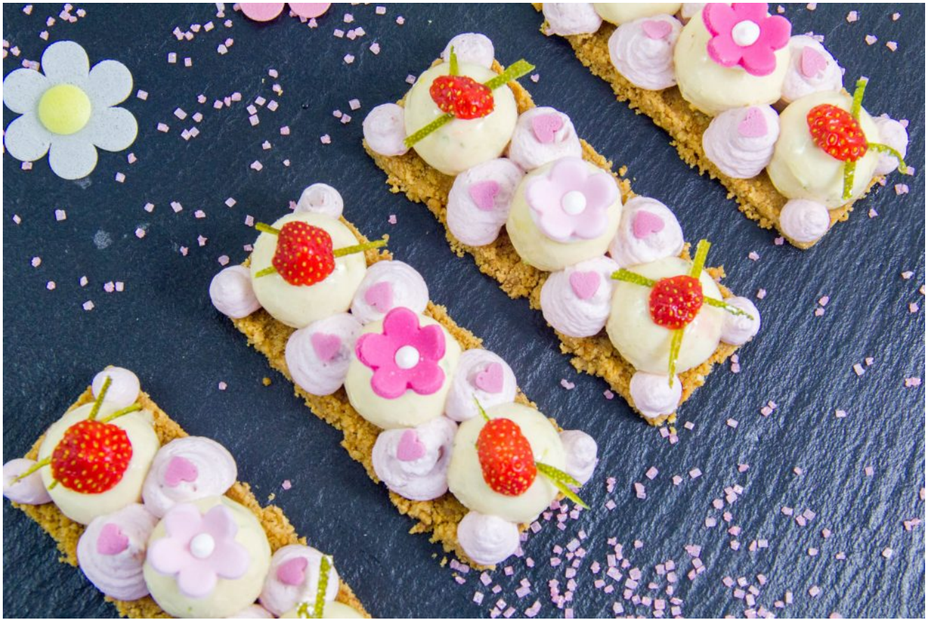
Mon Cheesecake revisité façon girly, fraise et citron vert