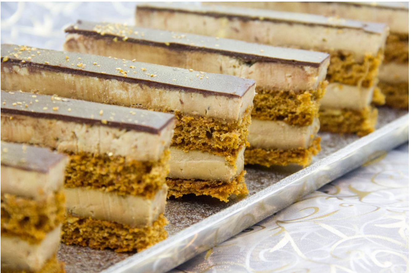
Coupez des tranches d'environ deux centimètres