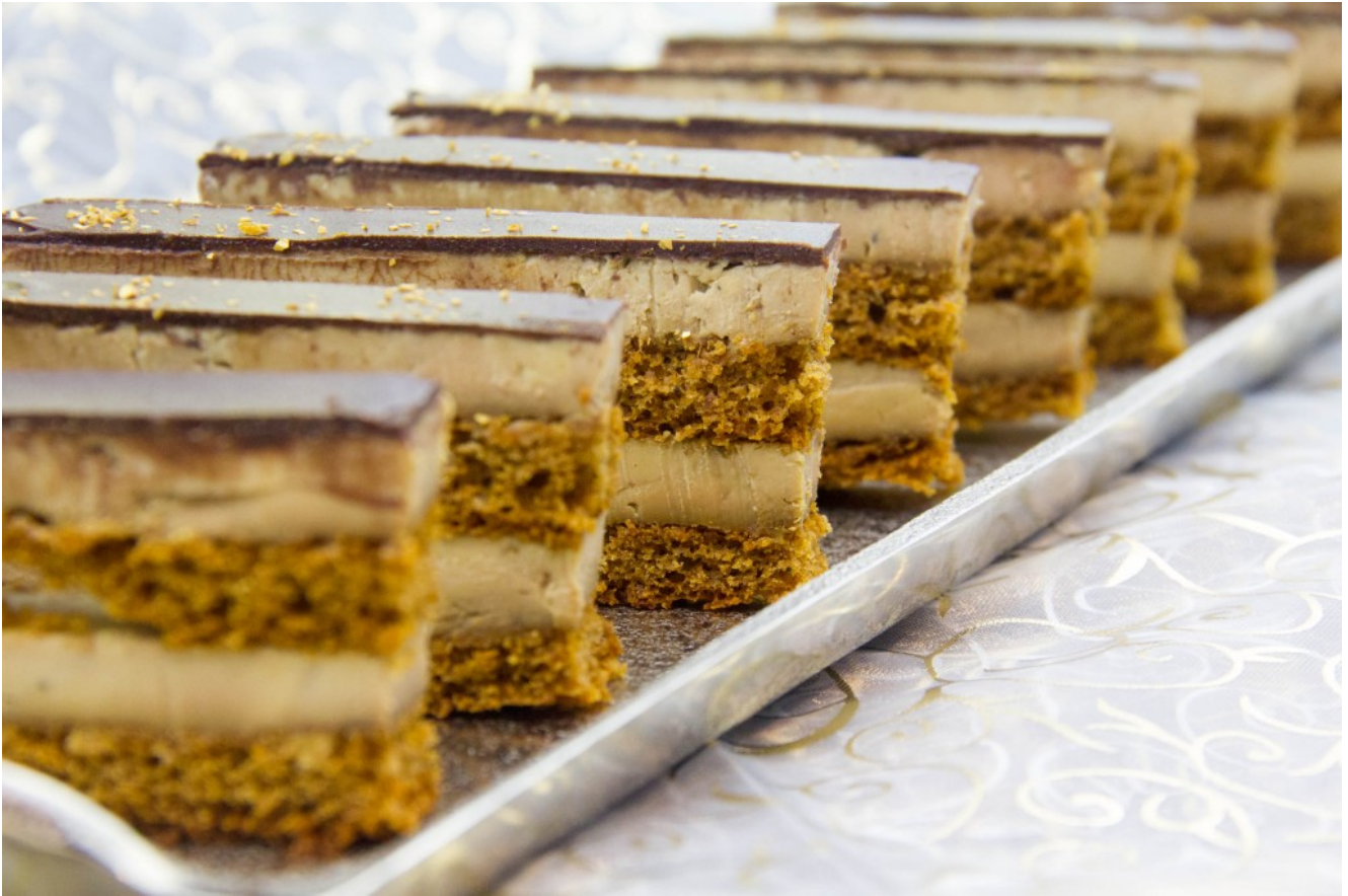
Foie gras façon « Opéra »