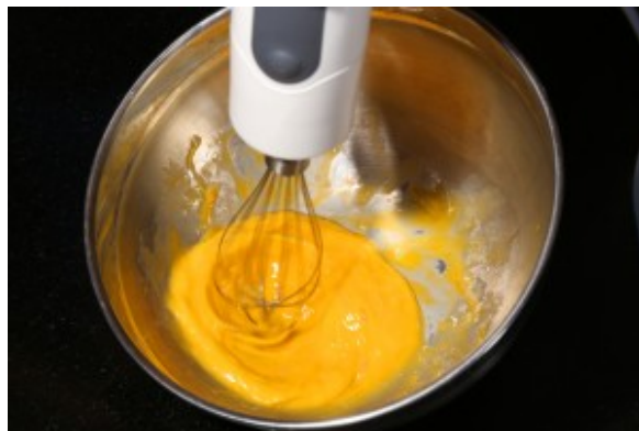
Mélangez le jaune et le blanc de l'œuf