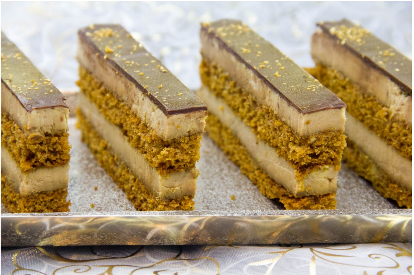
Foie gras façon « Opéra »

Et voici votre Foie gras façon « Opéra »: un vrai plat de fêtes!