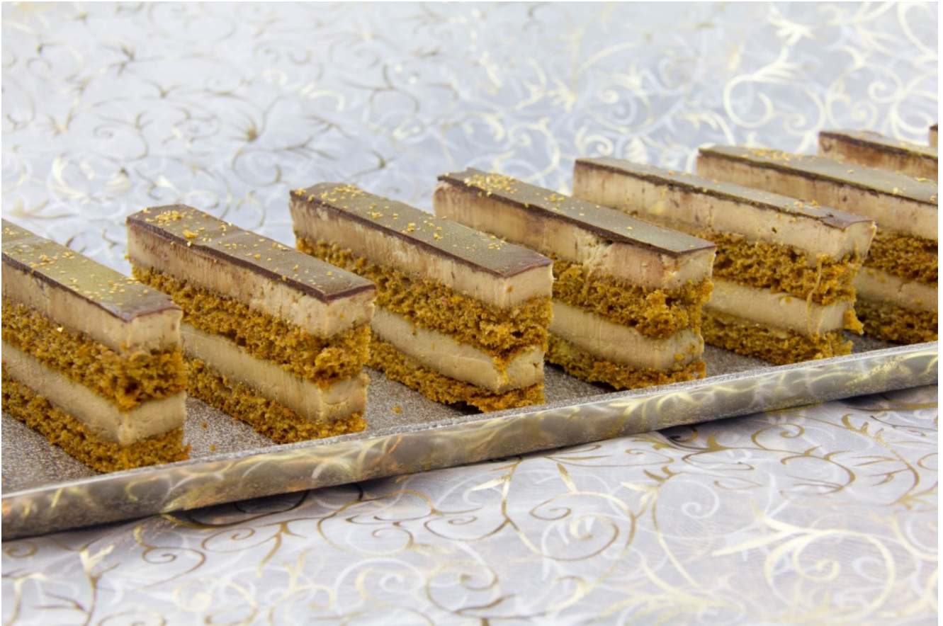
Foie gras façon « Opéra »