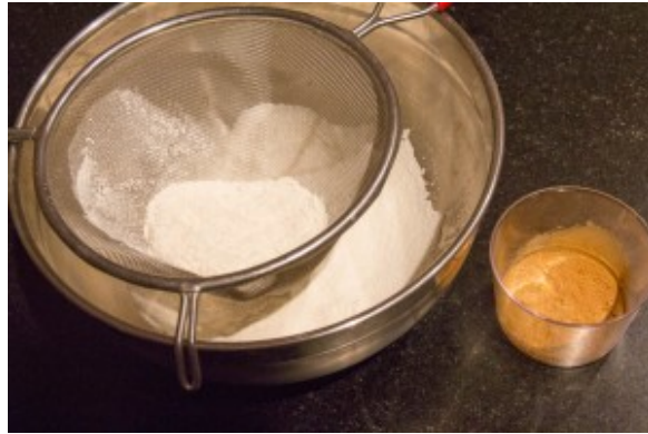
Tamisez les poudres