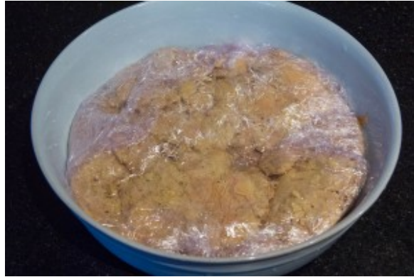
Le foie gras à la sortie du four