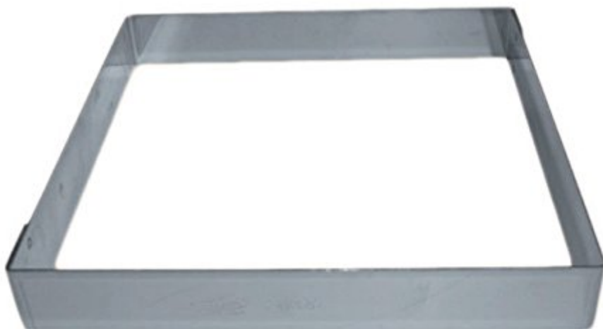
Carré inox pour entremet 18x18 cm, hauteur 3,5 cm