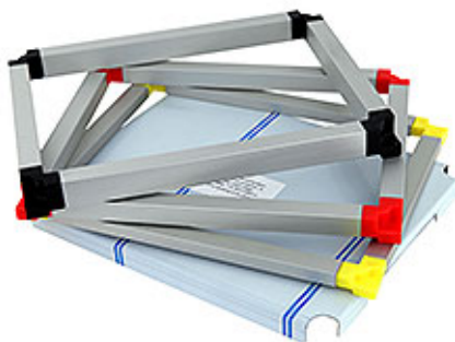
Cadres superposables – Kit de base 25 x 20 cm