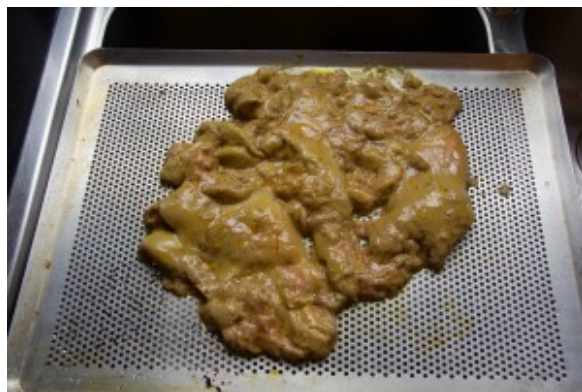
Faites égoutter le foie gras