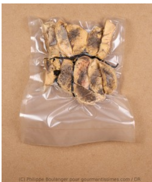
sachet sous vide