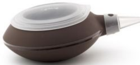
pipette decomax « lekue »