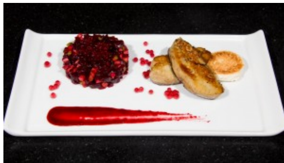
Autre idée de présentation...avec du foie gras poêlé