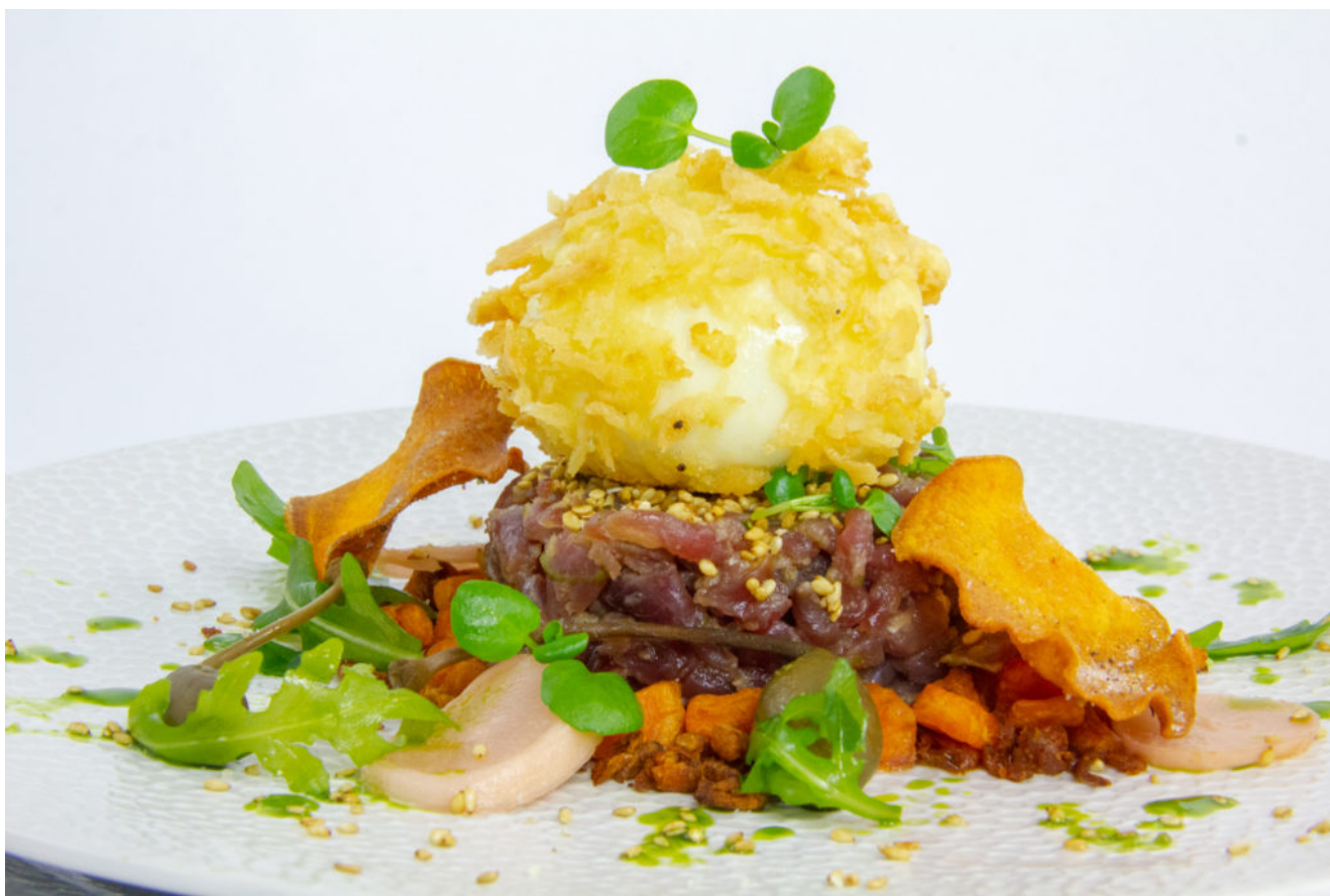
Mon tartare inattendu

Un tartare oui, mais un peu différent de l'original... Je l'ai réalisé à base de magret de canard avec une petite note asiatique, accompagné d'une vinaigrette au gingembre et d'un œuf croustillant et coulant. Les frites traditionnelles ont fait place à la patate douce. Une revisite qui devrait plaire à tous les gourmands!