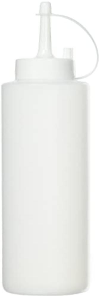
Metaltex 252960 Bouteille à Sauce Plastique 375 ml