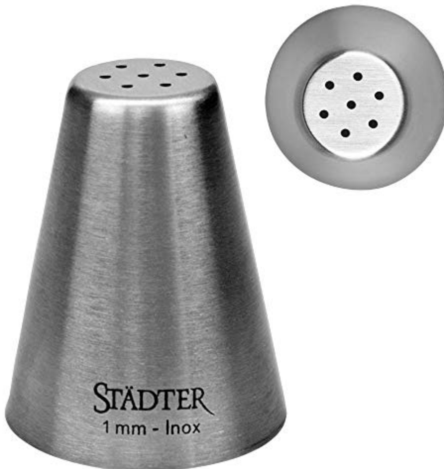
Staedter Fine Vermicelletulle, Argent, 7 x 1,5 mm