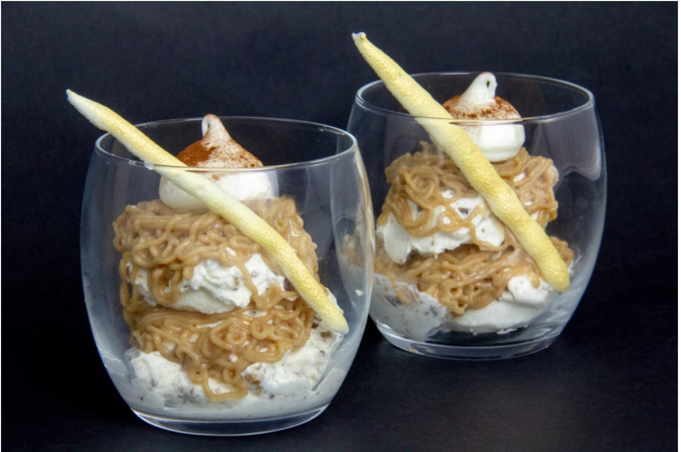
Mont blanc en verrine