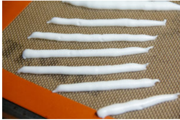
Décorations en meringue