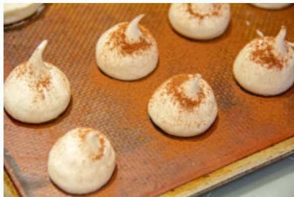
Décorez en saupoudrant du cacao