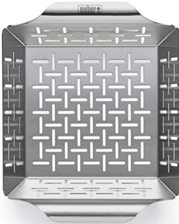
Weber 6481 Small Stainless Steel Vegetable Basket