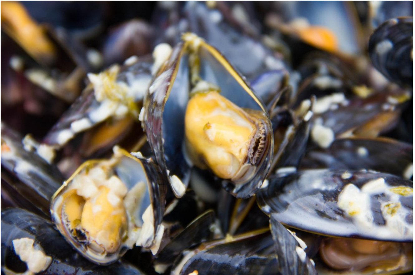
Moules au barbecue, sauce crémeuse à l'ail et au thym