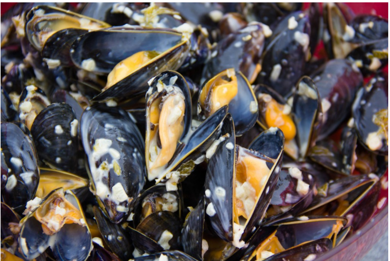
Moules au barbecue, sauce crémeuse à l'ail et au thym

Vous pouvez également servir ces moules pour un apéritif.