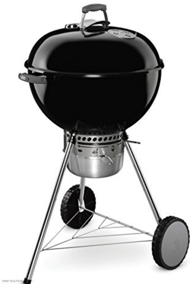
Weber Barbecue Charbon One Touch Premium 57cm Noir