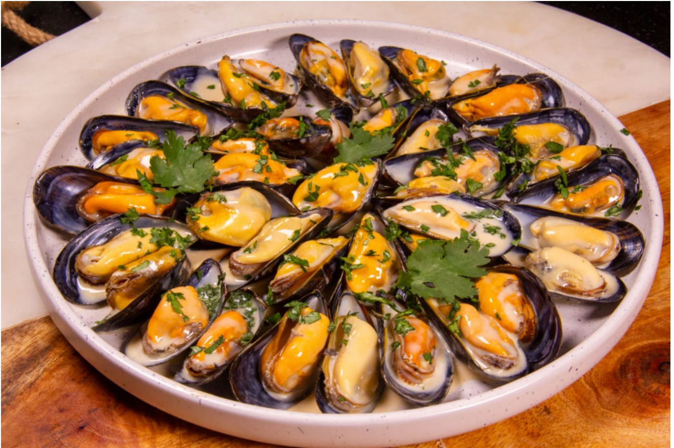
Moules au curry rouge et coriandre (recette Thermomix) au curry rouge