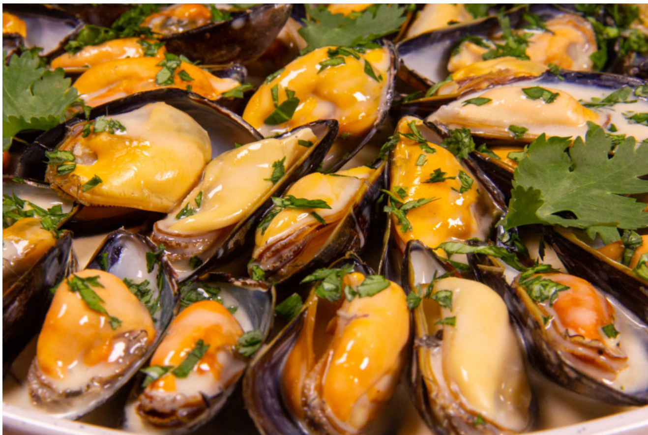
Moules au curry rouge et coriandre (recette Thermomix)