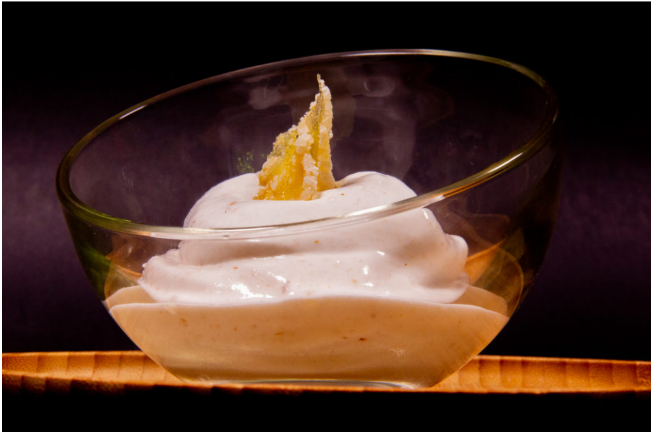
Mousse glacée litchis et gingembre (recette Thermomix)