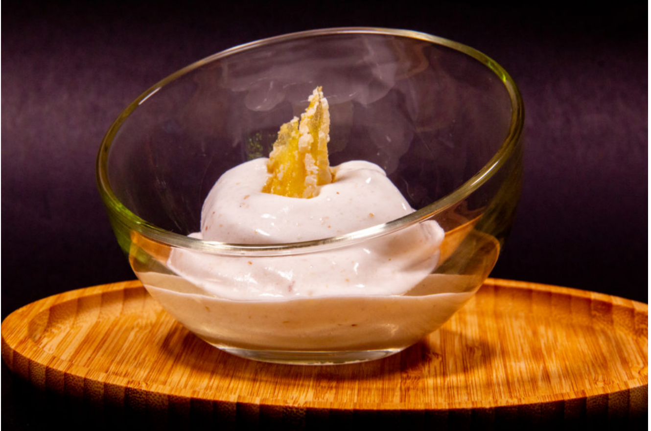
Mousse glacée litchi et gingembre confit