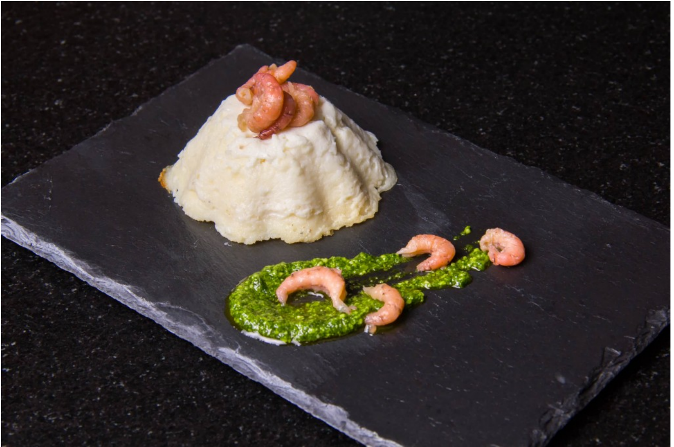
Mousseline de cabillaud aux crevettes grises, pistou à l'ail des ours