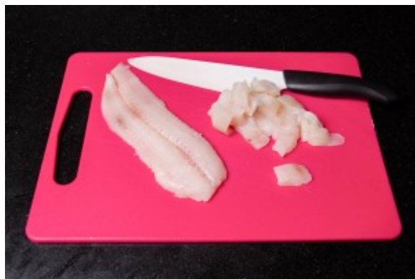
Coupez les poisson en morceaux.