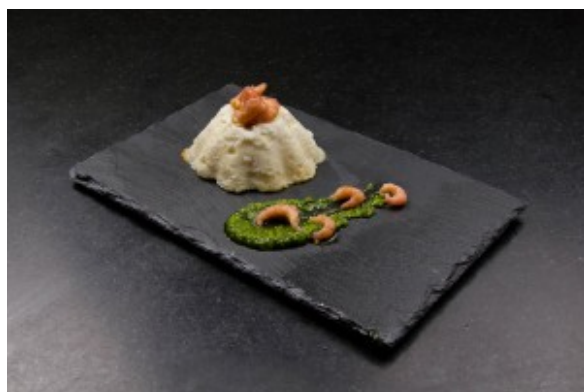
Mousseline de cabillaud aux crevettes grises, pistou à l'ail des ours

Contrairement à l'ail que nous connaissons il ne se présente pas en gousse; ce sont ses feuilles et fleurs qui ont un goût d'ail très prononcé, sans avoir les inconvénients digestifs de l'ail. Les feuilles ressemblent beaucoup au muguet. Attention ! Ne le confondez pas avec ce dernier qui est toxique !