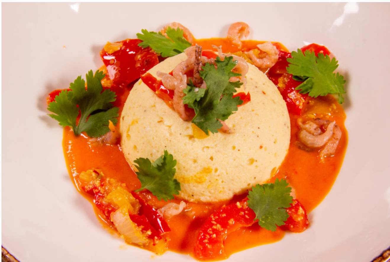
Mousseline de flétan et poivron

Encore un dernier parfum d'été avec cette jolie entrée que vous pouvez également servir en plat.