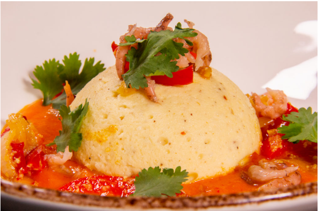
Mousseline de flétan et poivron