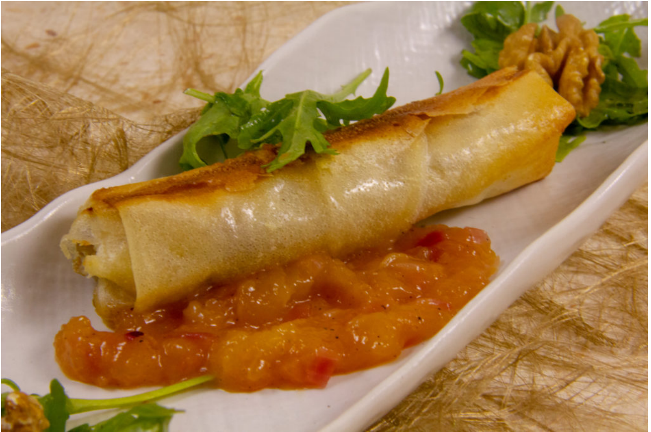
Nems de chèvre et poire aux noix