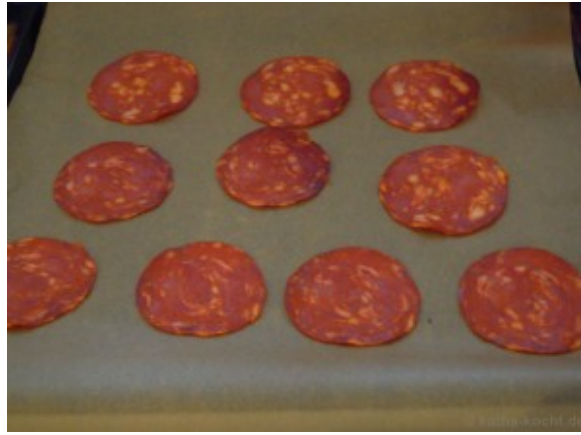
Chips de chorizo

Pour la purée de persil : on peut la préparer la veille et la réchauffer le jour même.