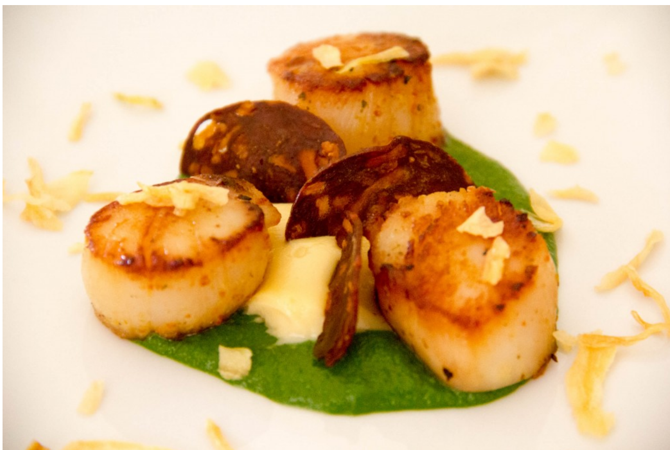
Noix de Saint Jacques en persillade et chorizo