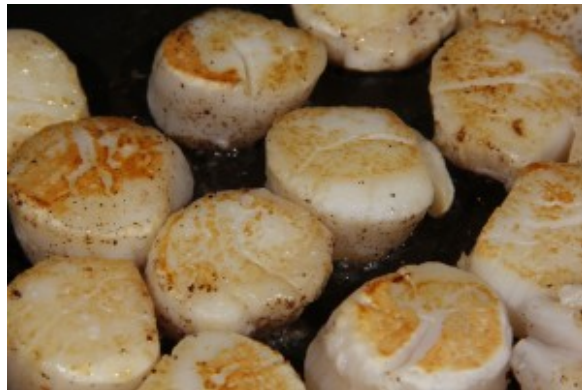
Poêlez les Saint Jacques