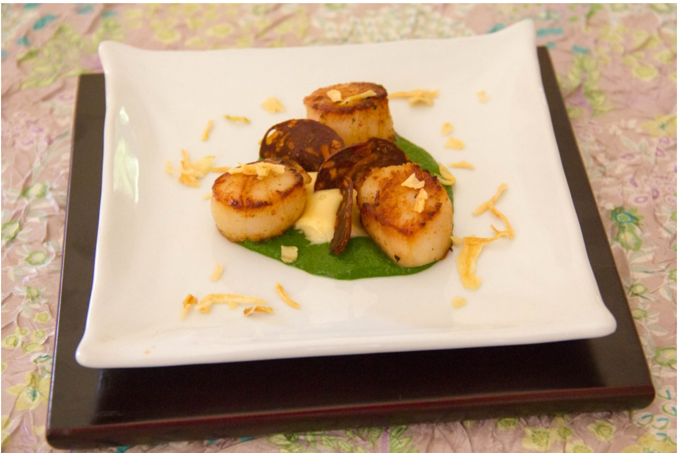
Noix de Saint Jacques en persillade et chorizo