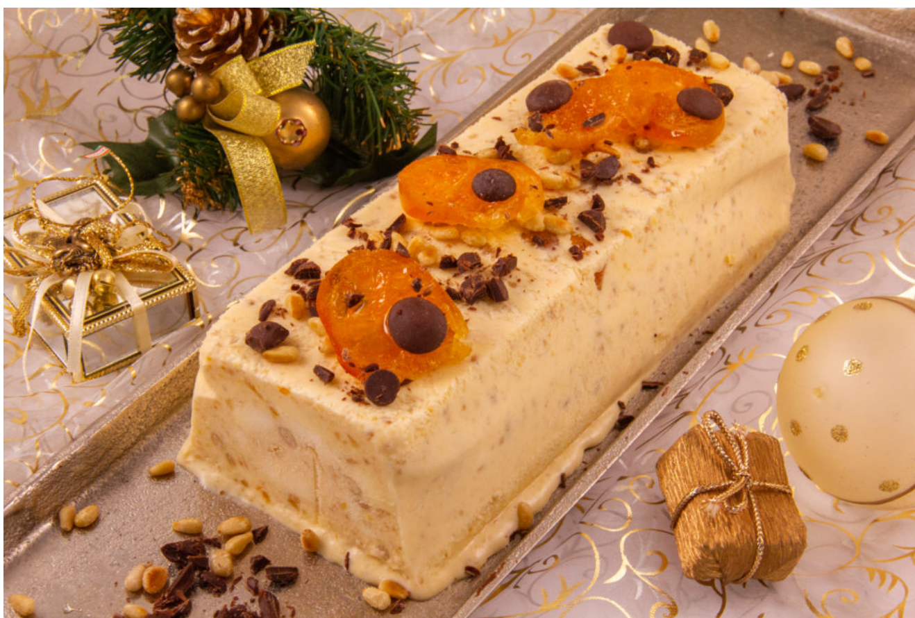
Nougat glacé mandarine pistache ou Nougat de Noël

Pour la recette adaptée au Thermomix cliquez ici