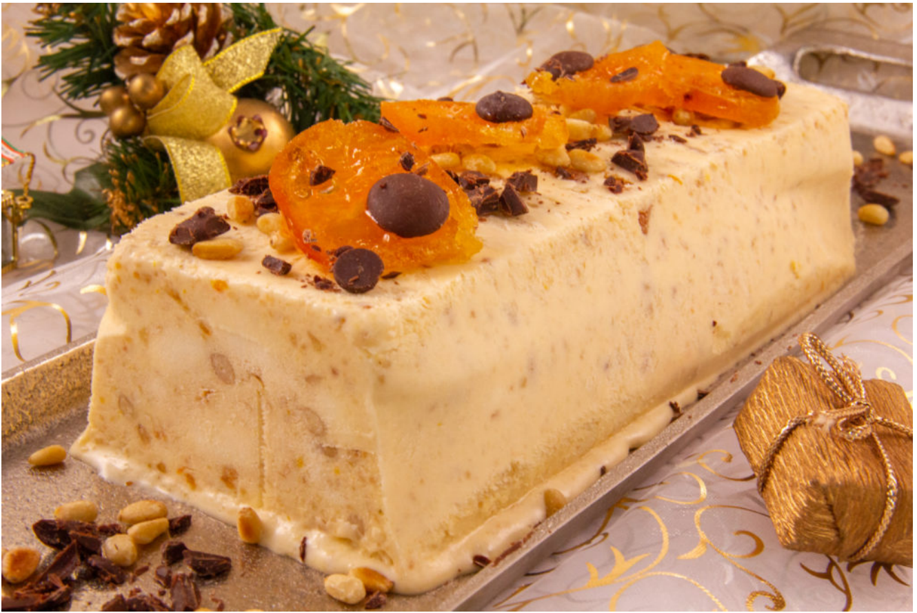
Nougat glacé mandarine pistache ou Nougat de Noël