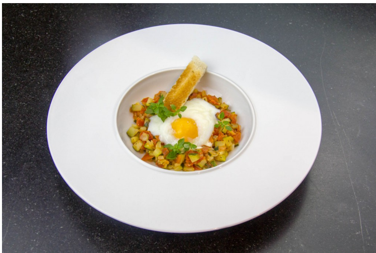
Oeuf basse température à la niçoise