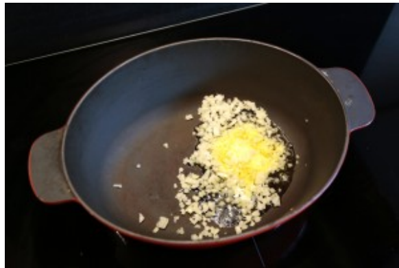
Faire revenir l'oignon