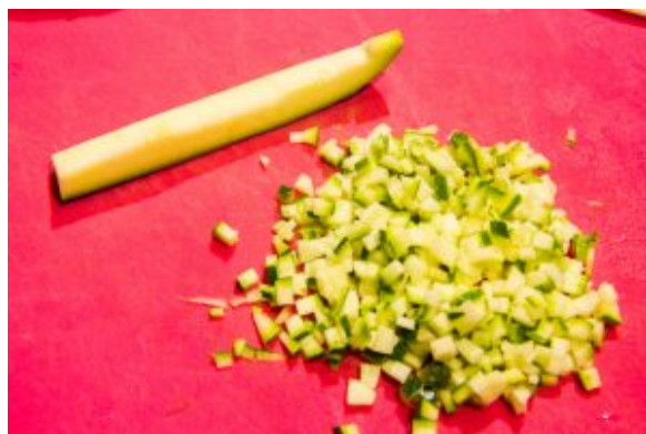
Puis détaillez les tronçons de courgette en toute petite