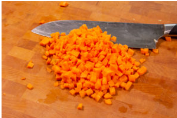
Coupez la carotte en brunoise