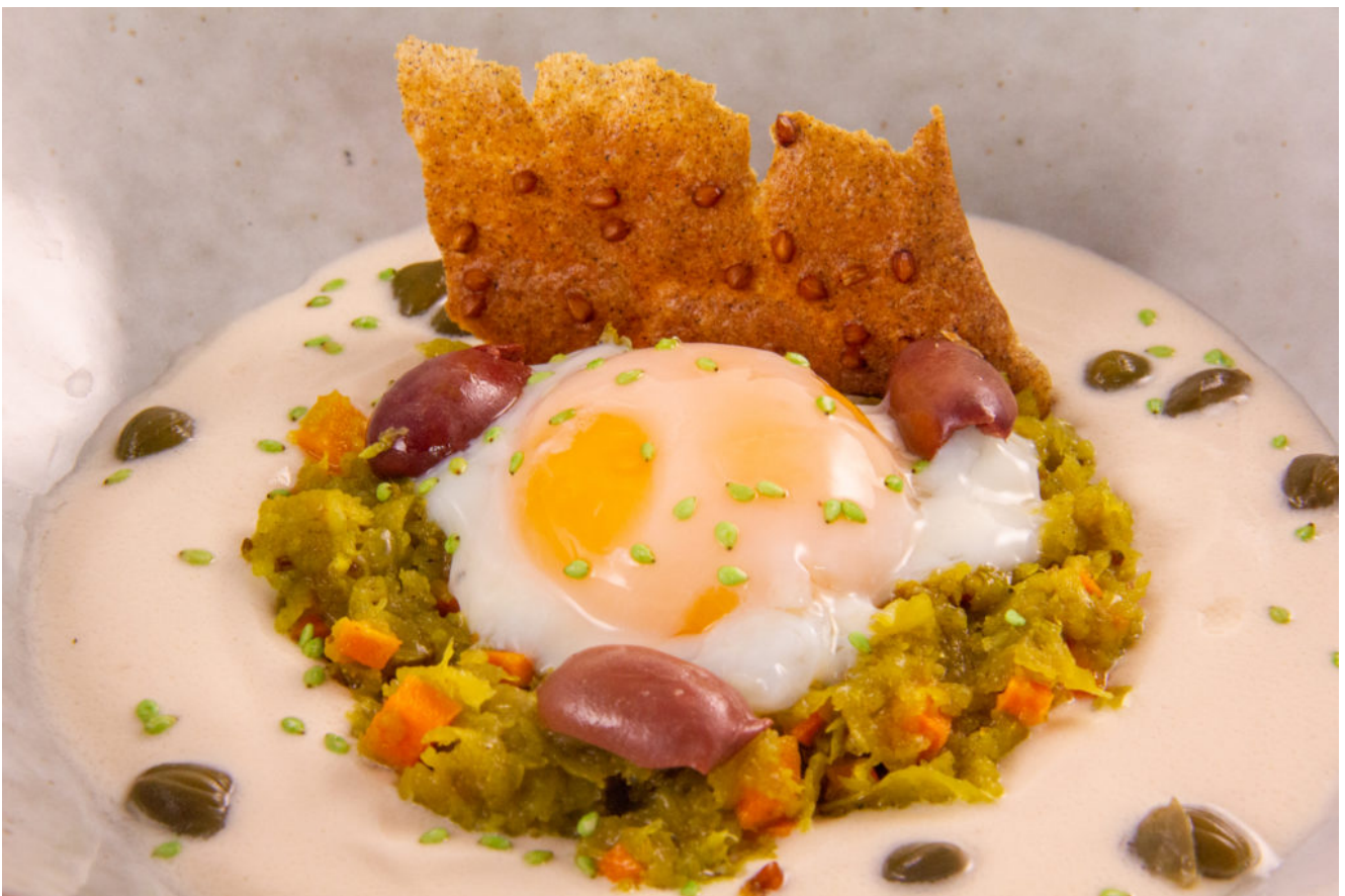
Œuf Oriental Basse température