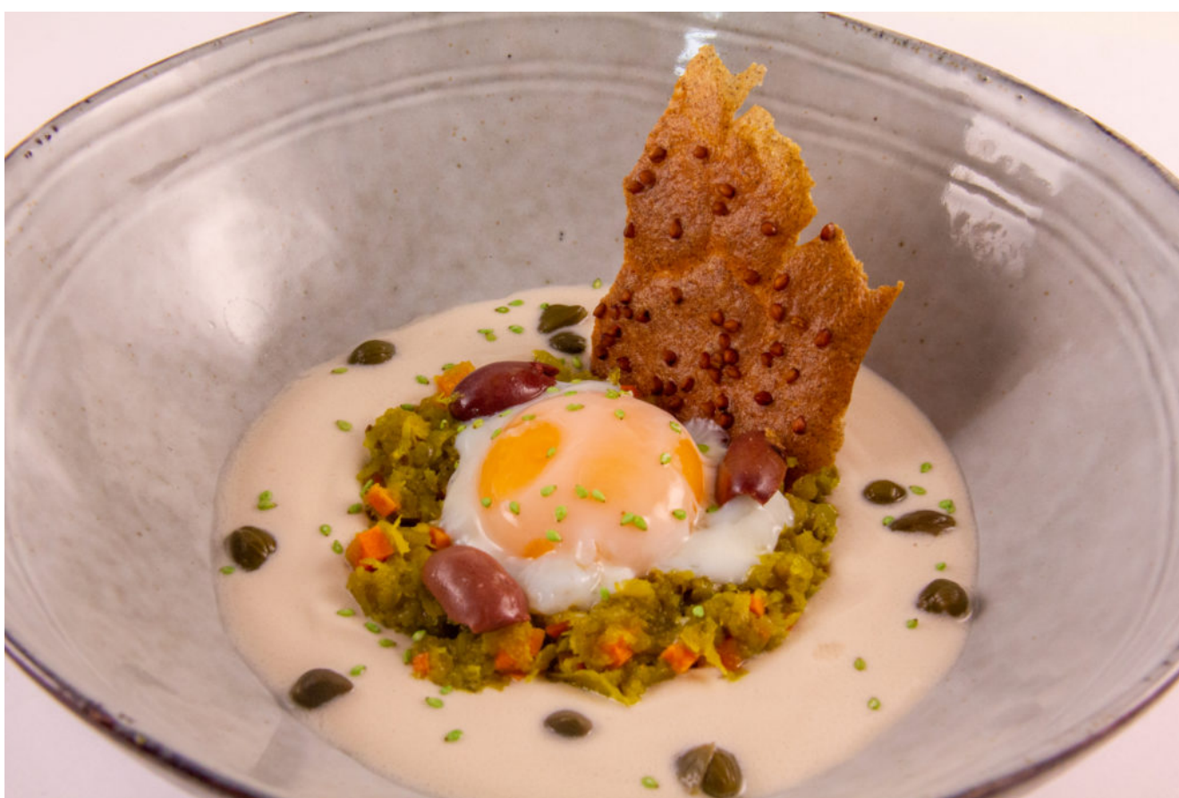
Œuf Oriental Basse température

Pour la recette adaptée au Thermomix TM6 cliquez ici .