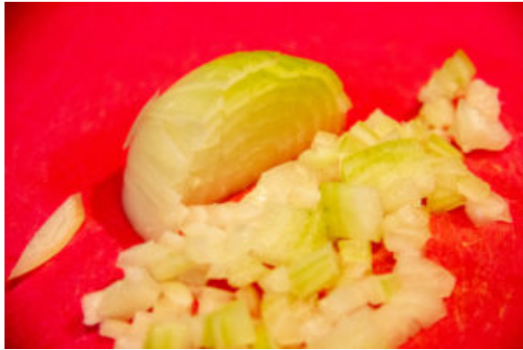
Coupez les oignons