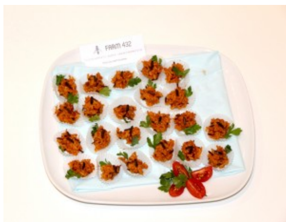
Bouchées gourmandes ...aux larves de mouche

Vous êtes prêts à vous lancer? Voici l'adresse d'un site où vous trouverez vos premières recettes: itada-kimasu.over-blog.com/