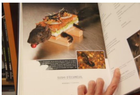
Montreal – Sushi d'écureuil

J'ai même vu, au Canada, un livre de cuisine du grand chef Martin Picard qui proposait la recette de sushis...d'écureuils. Si, si! Voici la preuve en photo: