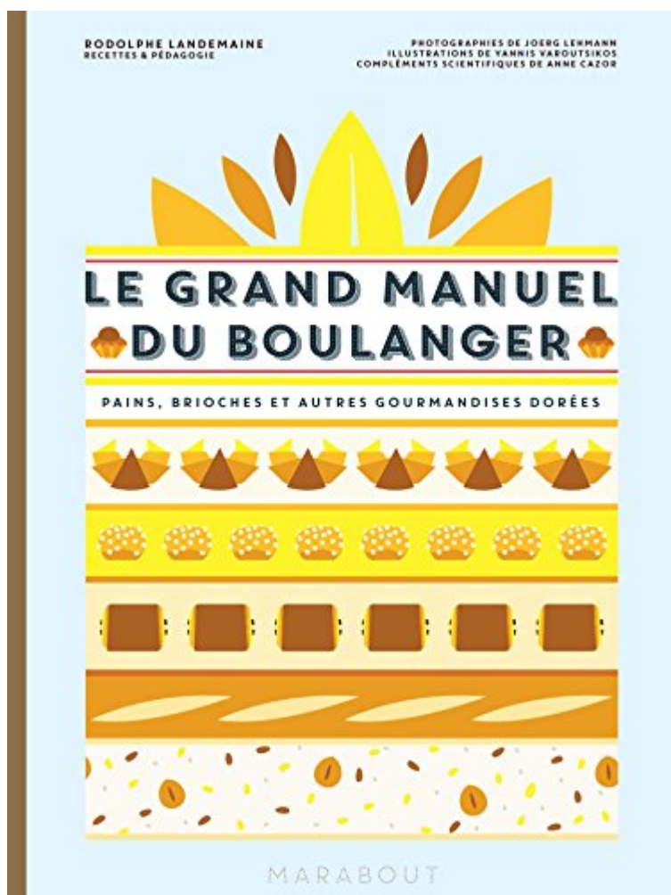
Le Grand Manuel du Boulanger

Un concept de livre très visuel. Vous pouvez l'acquérir en cliquant sur la photo ci-dessous :