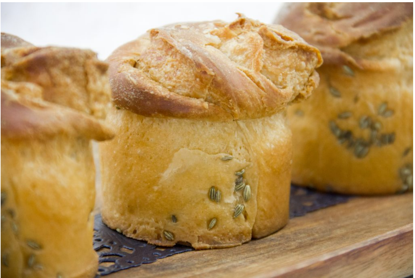
Pain brioché aux senteurs de Provence