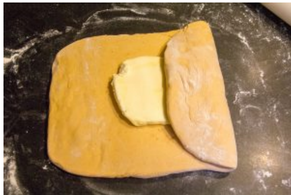
Puis rabattez les bords pour qu'ils se rejoignent au centre