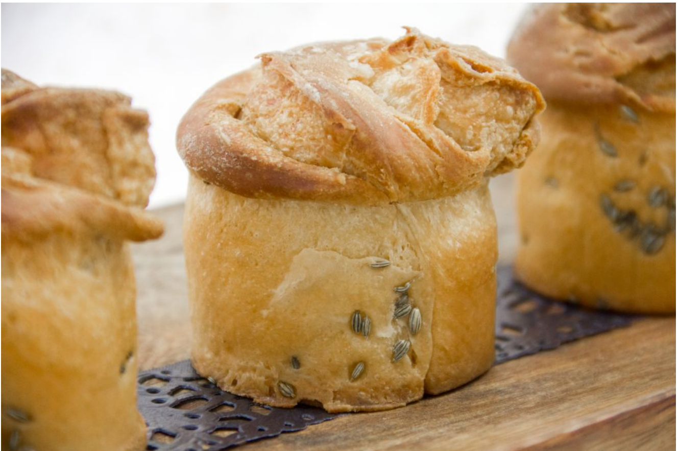
Pain brioché aux senteurs de Provence