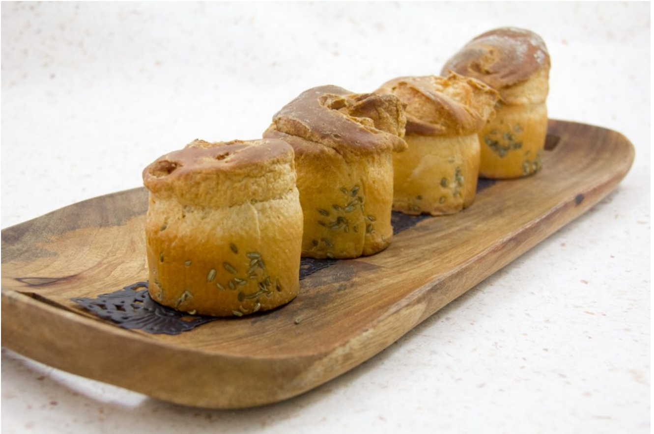
Pain brioché aux senteurs de Provence