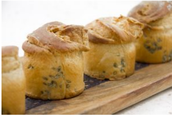
Pain brioché aux senteurs de Provence