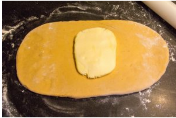
Posez le beurre sur la pâte